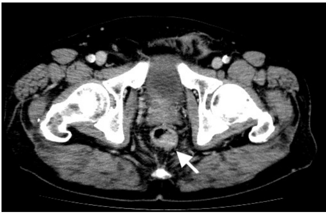
図1. 腹部造影 CT(矢印；腫瘍)

手術所見： 体位はブーツ型固定具(レビテーター® MIZUHO)を用いた大腿部水平固定での砕石位をとり、血栓予防として弾性ストッキングを使用し、間欠的空気圧迫装置を装着して手術開始した。ポート挿入は臍部、左右中下腹部の計5ヶ所で、術中気腹圧は10mmHgで腹腔内操作を行った。術中体位は主に、右回旋位を加えたTrendelenburg体位であった。皮下脂肪および内臓脂肪が多く、気腹下でも空間確保は困難であった。腹腔鏡下低位前方切除術、側方郭清を含むリンパ節D3郭清、一時的回腸人工肛門造設術を施行した。消化管再建はdouble stapling techniqueで端々吻合を行った。手術時間は10時間38分。出血量は370ml。手術中のTrendelenburg体位は合計9時間であった。術中の血圧維持にドパミン持続投与を行なった。手術中3時間ごとに除圧を行ったが、操作途中のTrendelenburg体位の解除は行なっていなかった。