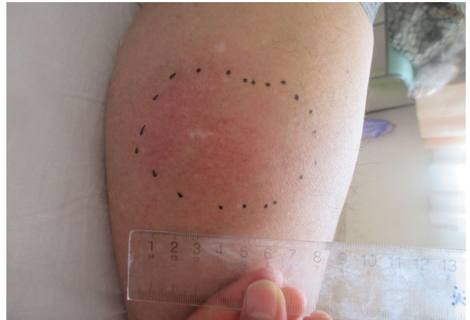
図3. 術後4日目の左下腿部.

に症状軽快傾向であったことから、筋膜切開などの処置を施行せずに十分な補液と注意深い経過観察による保存的治療を行なった。術後4日目に硬結部に一致した左下腿部の発赤を認めた(図.3)が、その後症状は軽快し、検査結果は術後8日目で正常化した(図.4)。横紋筋融解に伴う腎障害をきたすことも無かった。下肢痛は術後10日目にほぼ消失した。ストマ排泄過多によって、補液終了後に脱水と腎前性腎障害(Creatinine;Cr 1.24mg/dL)を来した(図.4)、排便コントロールに調整を要したため、術後21日目に退院した。