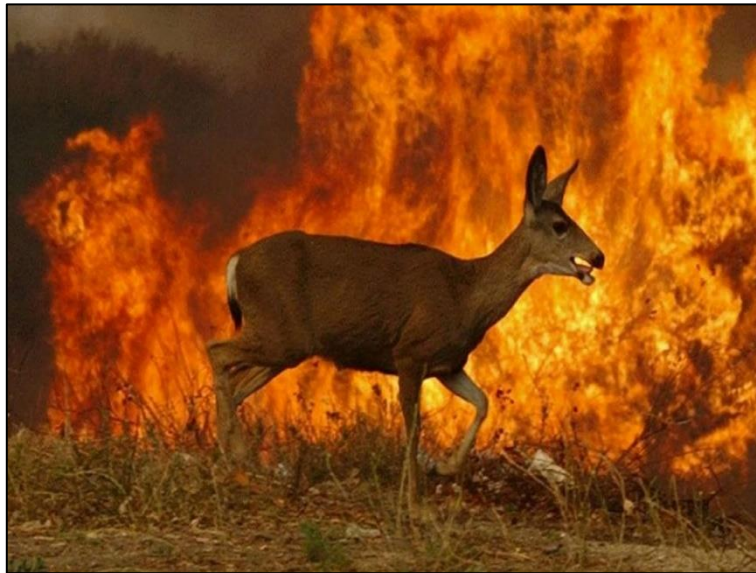
Figura 1. Imagem de incêndio em vegetação mostrando os efeitos do fogo sobre a fauna no Cerrado.

um incêndio, tendo ao fundo chamas altas provocadas pela queima de vegetação florestal. A imagem procurava explorar o impacto dos incêndios florestais em relação à fauna e a vegetação. Não havia descrição de localidade, nem do período, e nem de qual tipo de vegetação, mas a fauna deixava evidente que os cervos, comuns em todo território das Américas, são um dos animais mais ameaçados pelos incêndios.