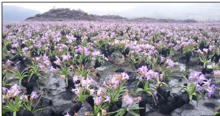
Figura 2. Floração de candombá (Velloziaceae) que tem como estratégia evolutiva a floração intensa e generalizada em resposta ao fogo.