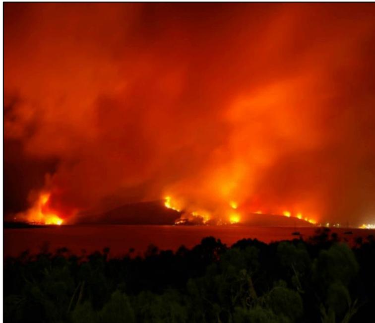
Figura 4. Incêndio na Espanha em 2017 decorrente das políticas de restrição ao uso de fogo.