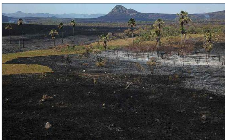
Figura 3. Vereda queimada - Jardim de Maitreya. Local de beleza cênica mundialmente conhecido (foto padrão em diversos meios de divulgação sobre a Chapada do Veadeiros).

A terceira imagem (Figura 3) refere-se a uma reportagem publicada no Jornal Correio Brasiliense, em 26 de outubro de 2017, que apresentava uma imagem icônica do Parque Nacional Chapada dos Veadeiros em Goiás. A matéria intitulada “Maior incêndio já registrado destrói cartões-postais na Chapada”, apresentava uma imagem do local conhecido como Jardim de Maytrea, uma paisagem de campo cerrado com ocorrência de altas palmeiras de Buritis , atingidas pelo fogo que devastou as gramíneas e arbustos da região. A imagem tem um apelo emocional, por se tratar de uma das paisagens mais icônicas desse parque nacional. E também apresentava a severidade dos incêndios que ocorriam na região dos cerrados nos últimos anos.