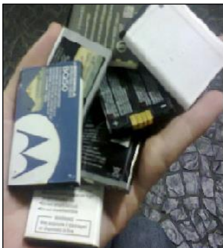
Figura 1. Baterias de lítio coletadas durante a campanha de coleta seletiva na Universidade do Sagrado Coração – USC (SP).

conforme apresentado na Figura 1. Assim, foi realizada uma triagem das baterias arrecadadas, sendo utilizadas apenas baterias de mesmo fabricante e modelo neste projeto, para evitar variação de composição e qualidade do resíduo utilizado.