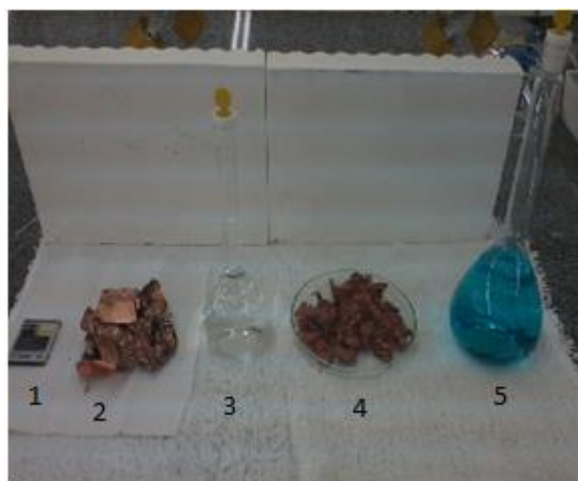
Figura 4. Esquemático do procedimento de preparação das soluções de Sulfato de Cobre durante a aula prática: 1) cobre como componente da bateria após uso; 2) obtenção das lâminas de cobre após abertura da bateria, contendo o ânodo; 3) preparação da solução ácida digestora; 4) lâminas de cobre após lavagem; 5) solução de sulfato de cobre.

reagentes, descartes dos mesmo e ainda reutilizar o cobre das baterias descarregadas. Dentre as soluções analisadas, a Solução 01 preparada pelo Grupo 01 apresentou os melhores resultados, portanto a mesma foi escolhida para a análise com a farinha de trigo.