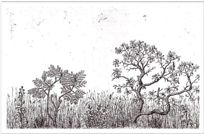
Fig. 2. Esboço da fisionomia do cerrado, próximo a Lagoa Santa, feito por Warming.

Após passar a Serra da Mantiqueira e sua continuação na Serra do Espinhaço, percebeu que gradativamente a exuberante vegetação florestal tropical ia sendo substituída por outra, campestre nos interflúvios e matas nos vales, acompanhando os cursos d'água. A partir daí, foram mais frequentes paisagens com uma vegetação campestre, com arvorezinhas baixas, com caules retorcidos e muitas gramíneas entre elas (Fig. 2). Em alguns vales, em solo brejoso, destacava-se a presença da palmeira buriti ( Mauritia flexuosa L.f. [ Mauritia vinifera Mart.]), hoje descrita como elemento dominante na paisagem das veredas.