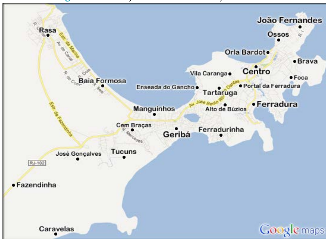
Figura 1 - Localização dos bairros de Armação dos Búzios