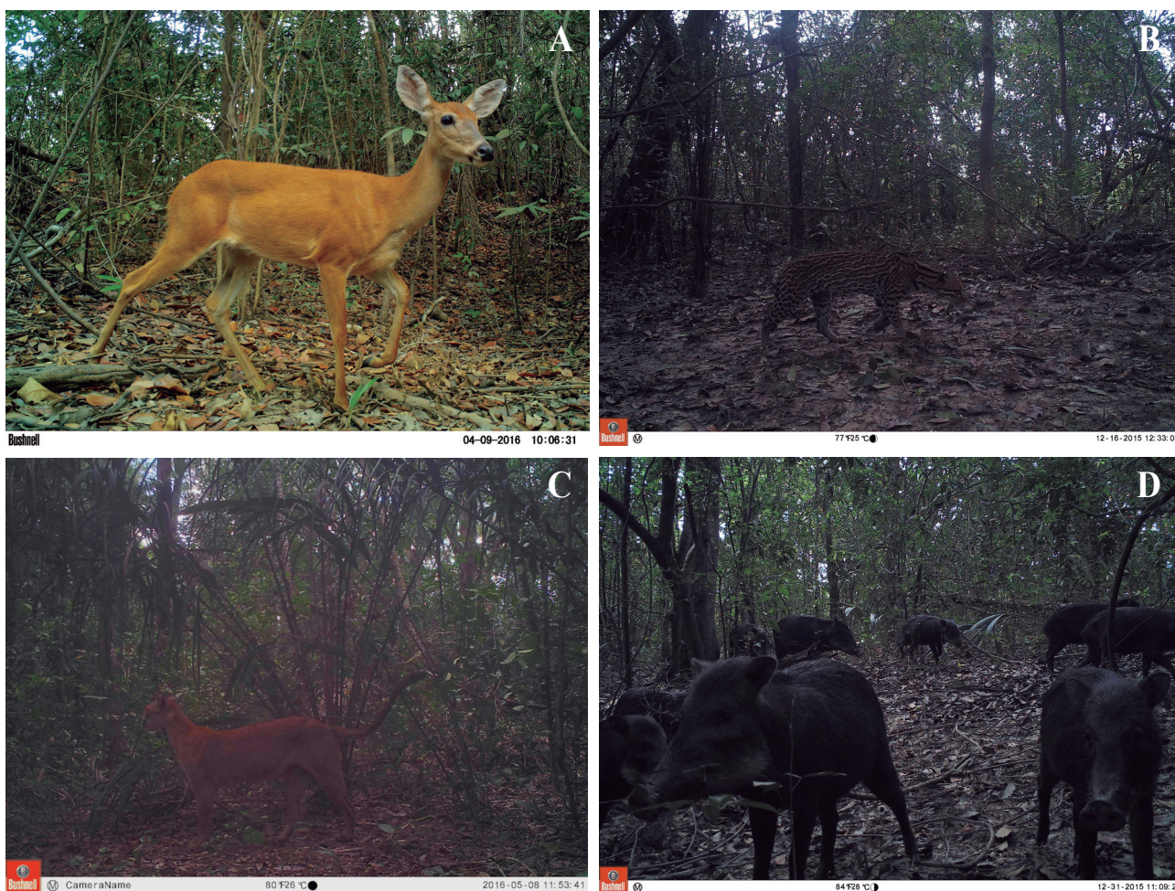
Figura 4a. Mamíferos registrados por cámaras trampa en la cuenca alta y media del río Bitá, Vichada, Colombia. A) Odocoileus cariacou , B) Leopardus pardalis , C) Puma concolor y D) Tayassu pecari .

estas especies los depredadores tope necesitan amplios requerimientos de hábitat para poder desarrollarse y tener una viabilidad poblacional (Holden y Neang, 2009; Cueva et al. , 2010). Sin embargo en los muestreos realizados empleando cámaras trampa no se ha logrado registrar el jaguar ( Panthera onca ), posiblemente su distribución se asocia más a coberturas forestales dominadas por los morichales cerca a las sabanas donde depreda animales domésticos ( Bos indicus y Sus scrofa ), agudizando así los conflictos entre ganaderos y grandes carnívoros (Garrote et al. , 2017).