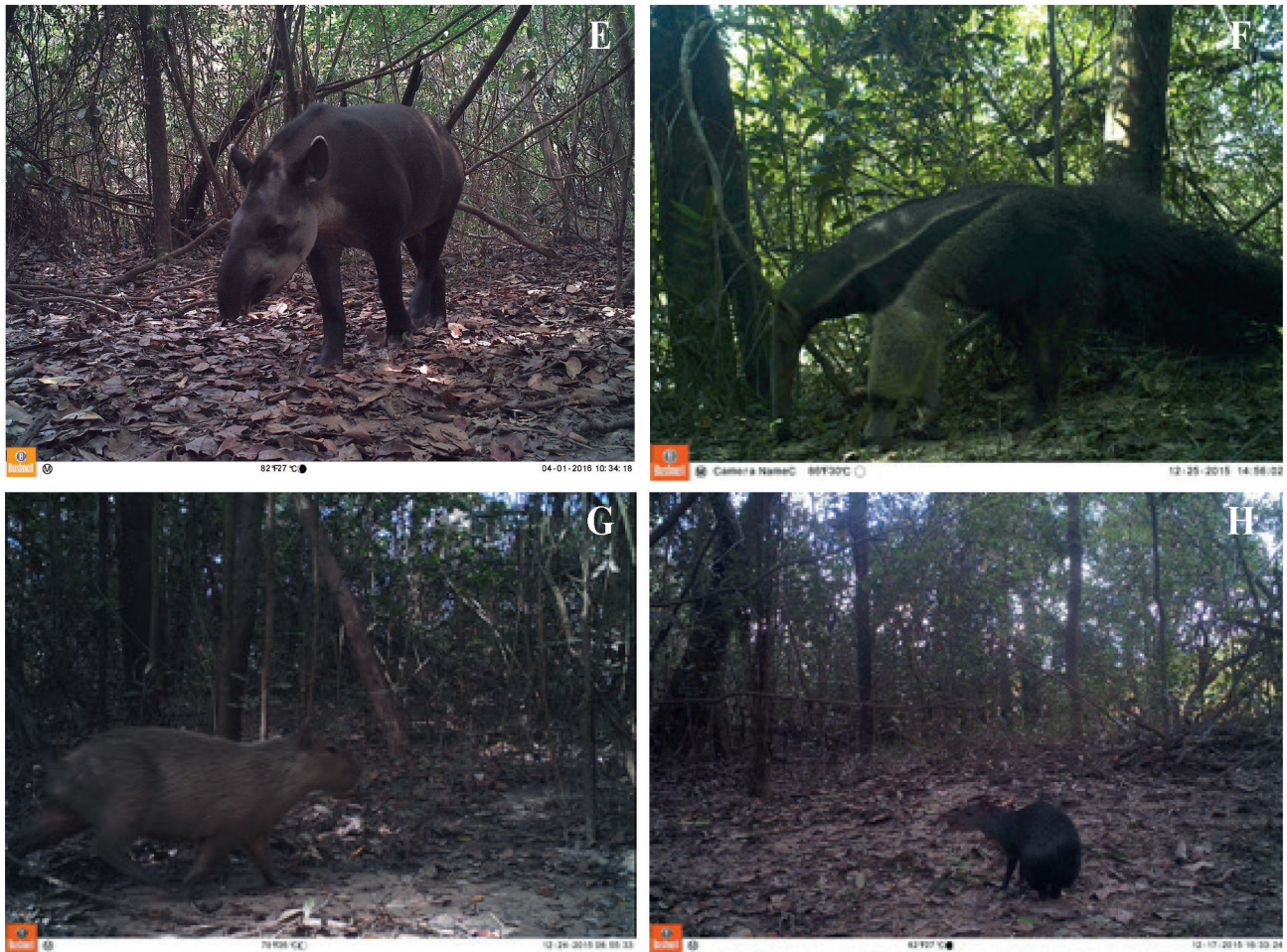
Figura 4b. Mamíferos registrados por cámaras trampa en la cuenca alta y media del río Bitá, Vichada, Colombia. E) Tapirus terrestris , F) Myrmecophaga tridactyla , G) Hydrochoerus hydrochaeris y H) Dasyprocta fuliginosa .