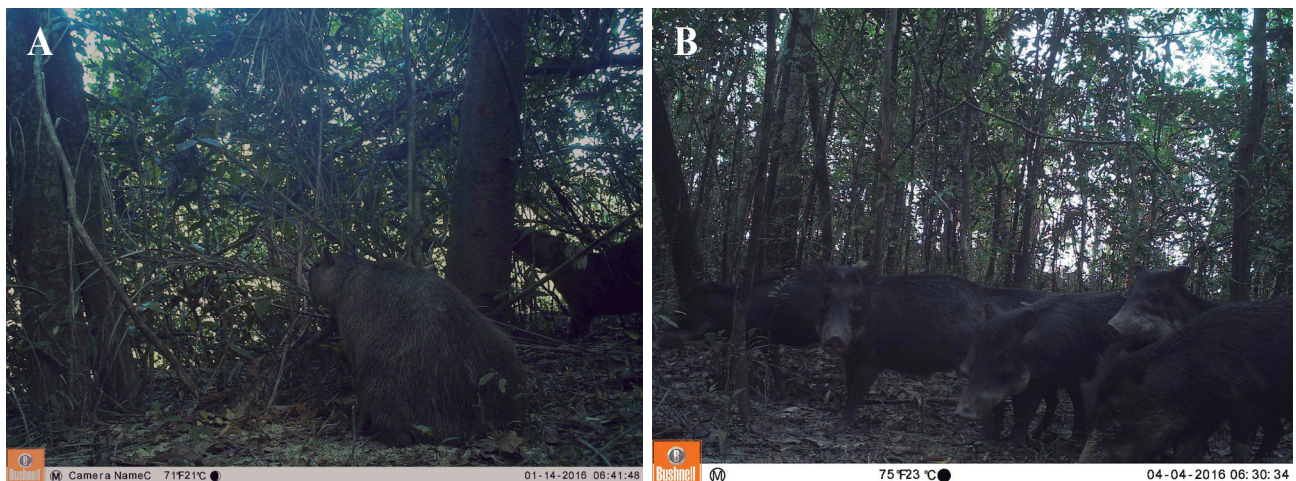
Figura 2. Presencia de parejas de hembras y machos adultos para A) Hydrochoerus hydrochaeris y B) Tayassu pecari en los bosques riparios del río Bitá, Vichada, Colombia.

De los 24 mamíferos registrados, los gremios tróficos estuvieron representados por los omnívoros ( n = 9 ; 37,5 %), carnívoros ( n = 6 ; 25,0 %), herbívoros/frugívoros ( n = 5 ; 20,8 %), insectívoros ( n = 3 ; 12,5 %), y 1 especie fue herbívora. Estos resultados coinciden con lo expuesto por Muñoz Saba et al. (2016) para la cuenca del río Meta, por Trujillo y Mosquera-Guerra (2016) para los ecosistemas de morichales de la Orinoquia y por Mosquera-Guerra et al. (2017) para el río Bitá. Se reportan: (A) depredadores tope como los felinos y mustélidos (carnívoros); (B) herbívoros/frugívoros (artiodáctilos, perisodáctilos y roedores), que contribuyen, de forma directa o indirecta, al mantenimiento o regeneración de los bosques porque consumen frutos, semillas y polen, por lo tanto favorecen los procesos de dispersión de semillas (Cadena et al. , 1998); y (C) armadillos y osos hormigueros (insectívoros), que contribuyen en el control de las poblaciones