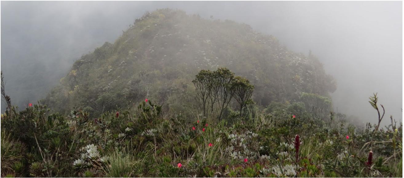
Figura 2. Las Palomas, municipio de Sonsón, Antioquia, Colombia, perteneciente al complejo Sonsón (3360 m s. n. m.).