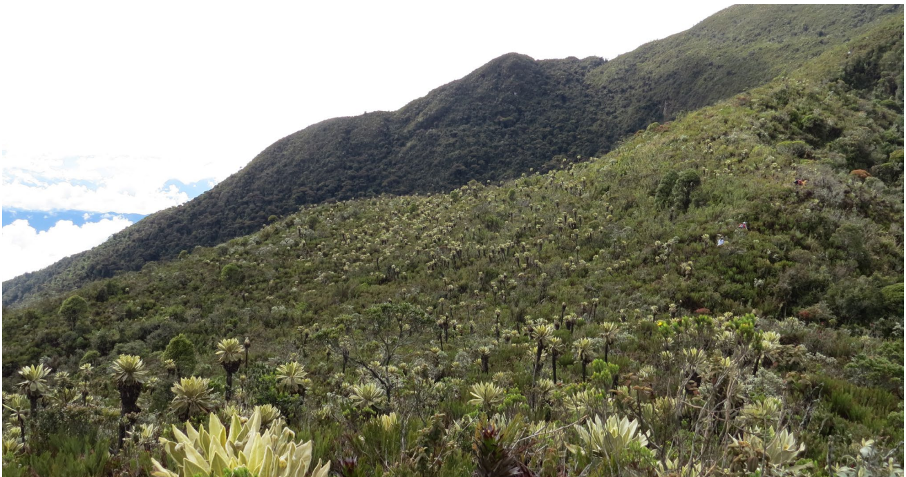
Figura 1. Cerro Plateado, municipio de Salgar, Antioquia, Colombia, perteneciente al complejo Frontino-Urrao (3700 m s. n. m.). Fotografía: Sergio Chaparro-Herrera.