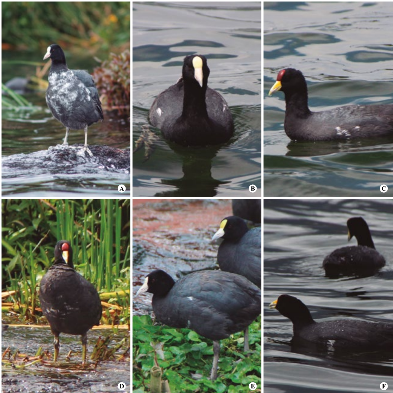
Figura 2. Focha andina ( Fulica ardesiaca ), adultos con envejecimiento progresivo y leucismo registrados en el Lago San Pablo.

A Sebastián Mena González por la fotografía (A) y la elaboración del mapa. A los revisores que con sus sugerencias contribuyeron a mejorar este trabajo.