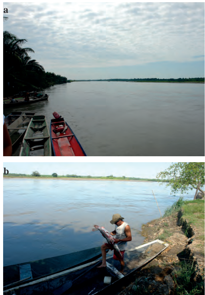
Figura 2 a) Río Meta; b) Pescador en río Meta.