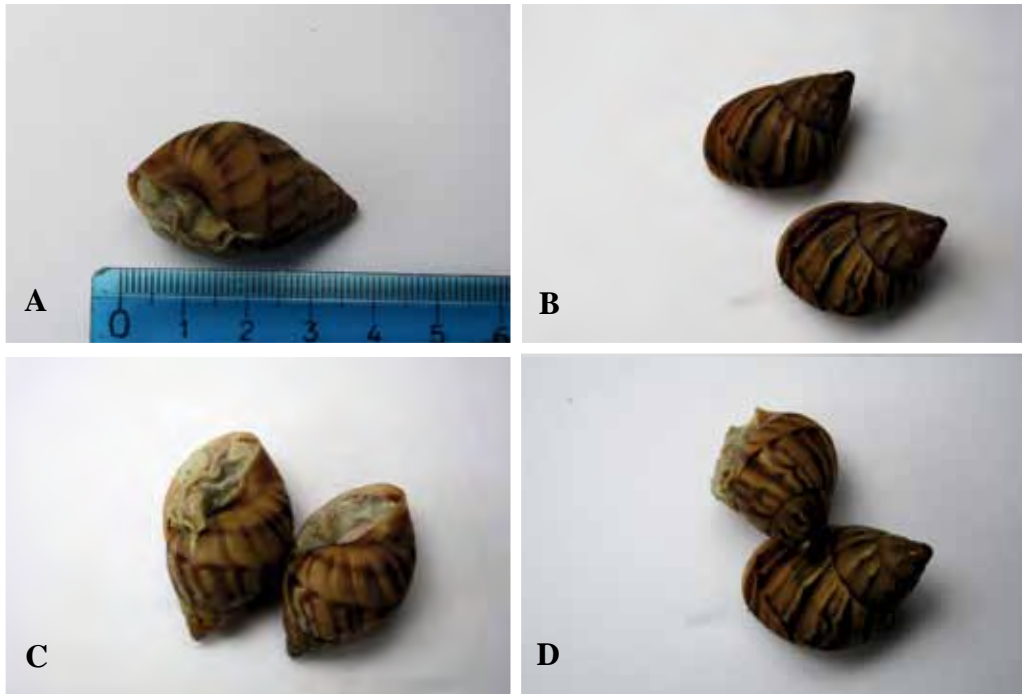
Figura 1. Achatina fulica : (A) longitud total de la concha; (B) vista dorsal; (C) vista ventral; (D) vista lateral de los individuos juveniles.

de las islas de Las Antillas, Brasil y Venezuela (Martínez-Escarbassiere et al. 2008). Es una de las 100 especies invasoras más perjudiciales del planeta y se la localiza actualmente en todos los continentes en climas tropicales y subtropicales (Raut y Barker 2002). Es una especie muy resistente y se le considera por su ataque a cultivos, una amenaza para la agricultura, los ecosistemas nativos y la fauna silvestre, además actúa como vector de enfermedades humanas (IUCN 2010).