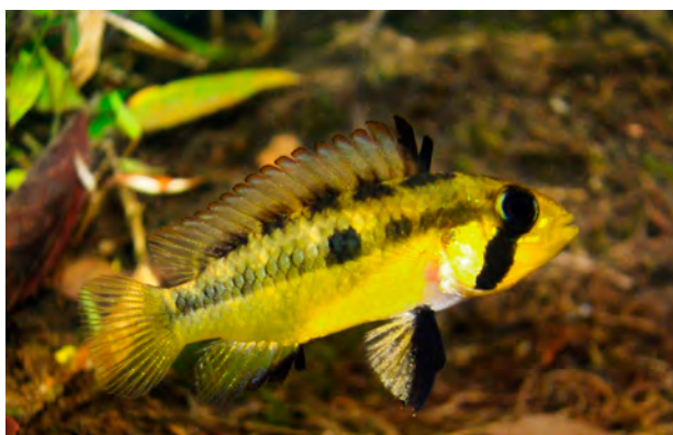
Figura 6. Hembra de Apistogramma megaptera .