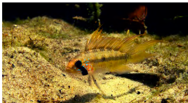
Figura 5. Macho de Apistogramma megaptera .