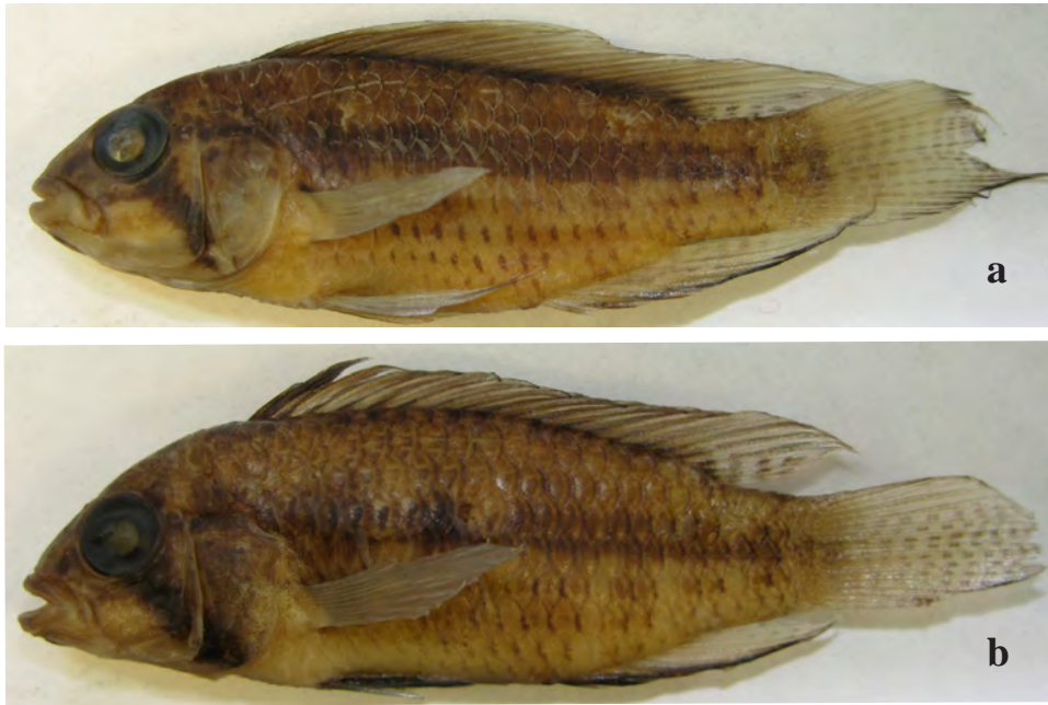
Figura 1. Apistogramma megaptera , especie nueva. (a). Holotipo (IAvH: 11714). (b). Paratipo (MHNLS: 22546).

parte” con la tendencia de la proporción longitud fin aleta dorsal-anal/LE 16,5 a 19,3 vs. A. iniridae 15,6 a 16,9) y por tener una cabeza alta en proporción a la longitud del cuerpo (profundidad de la cabeza/LE 28,2 a 30,6 vs. A. iniridae 24,3 a 26,1) (Tablas 1 y 4).