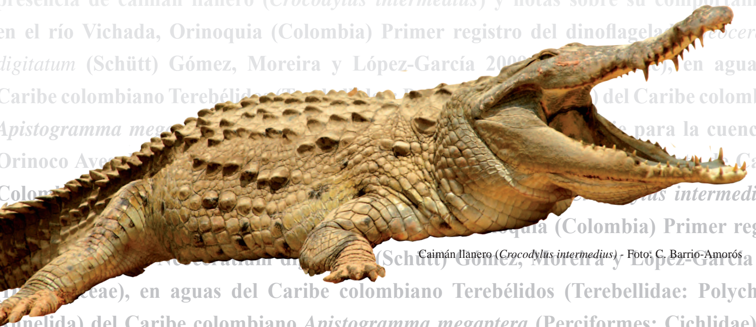
Caimán llanero ( Crocodylus intermedius ) - Foto: C. Barrio-Amorós 2009

Volumen 12 • Número 1 • Enero - junio de 2011