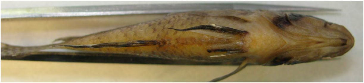
Figura 2. Línea media ventral en hembras.