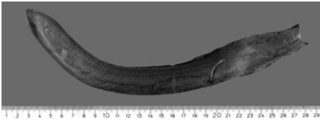
Figura 1. Imágen de Lepidosiren paradoxa IAvHP: 3995. / Figure 1. Image of Lepidosiren paradoxa IAvHP: 3995.