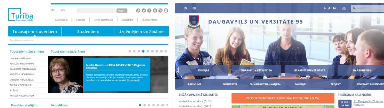
3. attēls. Biznesa Augstskola Turība (BSA) un Daugavpils Universitāte (DU) mājas lapas dizains ( http://du.lv , http://www.turiba.lv ).

Jāatzīmē, ka viena liela kopēja iezīme krāsu ziņā, kas vērojama gandrīz visu izpētīto augstskolu mājas lapām ir, ka to vizuālajā noformējumā tiek pielietots pelēkais tonis, kas papildināts ar vienu papildus toni kā akcentu dizaina elementiem. 10 augstskolām no 15, mājas lapas dizainā ir pielietota zilā krāsa, dažādās šīs krāsas tonalitātēs. Zilā toņa nianse tiek pielietotas tādu augstskolu, kā Biznesa Augstskola Turība (BSA), Latvijas Universitāte (LU), Daugavpils Universitāte (DU), Liepājas Universitāte (LiepU), Rēzeknes Tehnoloģiju akadēmija (RTA), Baltijas Starptautiskā Akadēmija (BSA), Banku Augstskola (BA) (skat. 3. att.).