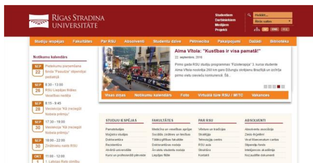
5. attēls. Rīgas Stradiņa Universitātē (RSU) mājas lapas dizains ( http://rsu.lv ).

Rīgas Stradiņa Universitātes (RSU), LSPA un Rīgas Juridiskās augstskolas (RJA) mājas lapā dominē karmīnsarkanā (Latvijas karoga sarkanais) un pelēkā toņa krāsu salikums, kas arī ir veiksmīga izvēle (skat. 5.).