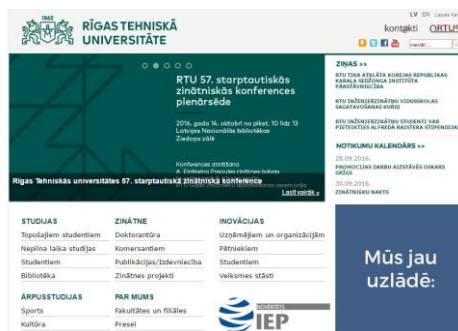
4. attēls. Rīgas Tehniskās universitātes (RTU) mājas lapas dizains ( http://rtu.lv ).

Jāpiebilst, ka kompozicionālais risinājums un krāsa spēj veiksmīgi nodrošināt saskari ar iestādes mērķauditoriju un veiksmīgi atspoguļot zīmolu.