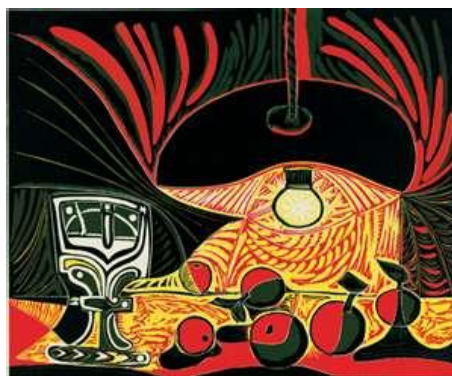
7. attēls. Pablo Pikaso. Klusā daba ar glāzi zem lampas, 1962, krāsains linogriezums ( http://garlicprint.com/page/12/ )

Savukārt klusās dabas kompozīcija, kas parādīta sekojošā attēlā (skat. 7. att.), pētījuma autorei deva „ atspēriena punktu ” – drošas koloristikas, grafiskās izteiksmes un valodas īpatnējā gleznieciskuma izvēlei arī savu individuālo kompozīcijas struktūru izveidei. Šajās kompozīcijās jūtama gaismas un tumsas mijiedarbība, savstarpējā simbioze un sava veida „ īņ un jaņ ” saskarsmes parāde.