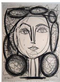
1. attēls. Pablo Pikaso. Fransuaza, 1946, litogrāfija ( http://www.blogmuseupicassobcn.org/2011/05/exploring-lithography-through- )

Pikaso patika eksperimentēt, nepārtraukti attīstīt savu māksliniecisكو varēšanu, un viena no tehnikām, ar kuras palīdzību viņš tika pie daudziem atklājumiem, bija litogrāfija (skat. 1. att.).