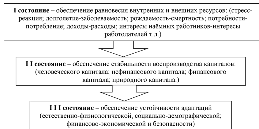
Рис. 3. Состояния адаптационного потенциала населения

На основе теоретического и методологического обоснования предлагаются элементы агрегированного индекса адаптационного потенциала населения, которые характеризуют народосбережение, условия для долгой и здоровой жизни населения, обеспечения полной занятости, справедливой оценки труда наёмных работ-