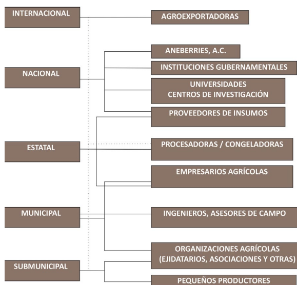
FIGURA 2 INTERACCIONES MULTINIVEL EN EL SISTEMA PRODUCTIVO DE ZARZAMORA, MÉXICO

Todo lo anterior, permite observar dinámicas de aprendizaje, de apropiación, de circulación de conocimientos y de innovación social, no exentas de ries-