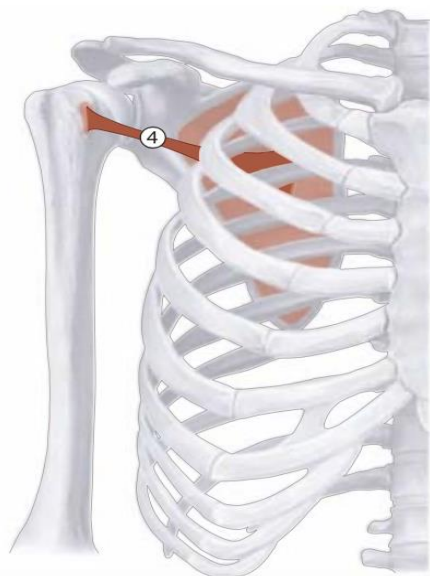
FIGURA 2. Anatomía del manguito de los rotadores