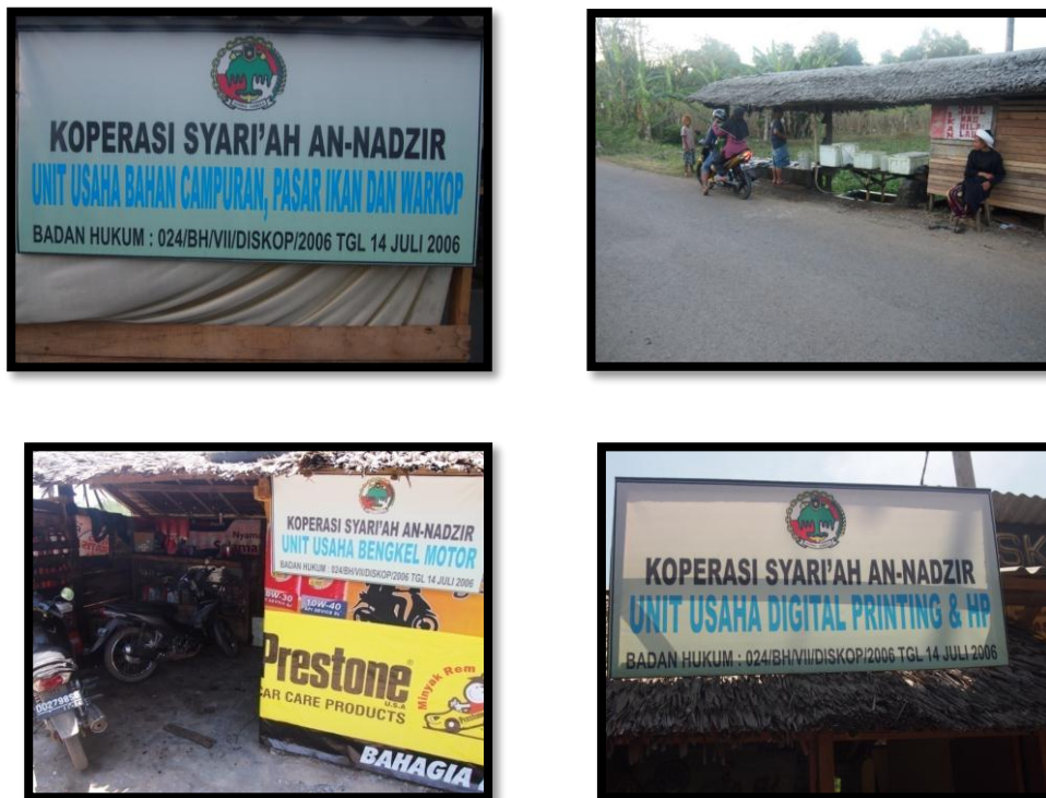
Gambar 1 Unit Usaha Jamaah An-nadzir

anggota jamaah yang hadir dengan memperlihatkan wajah kekaguman atas pernyataan Ustadz Rangka.