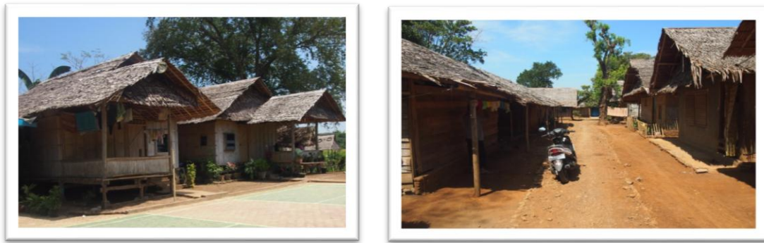
Gambar 4 Model Pemukiman Jamaah An-Nadzir di Daerah Mawang