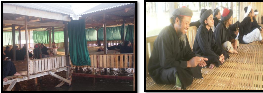
Gambar 3 Musholla dan Tampilan Fisik Jamaah An-Nadzir