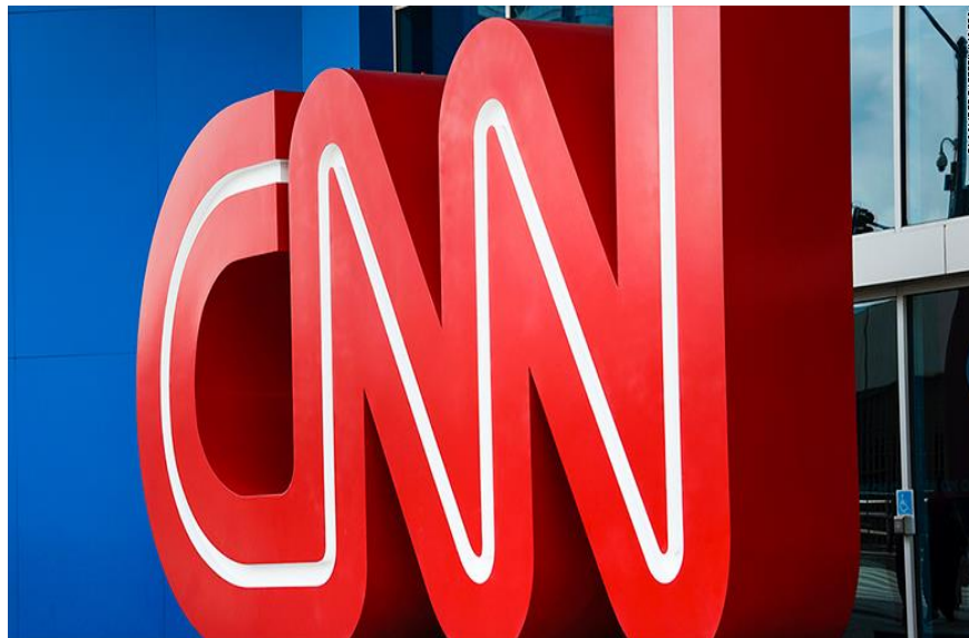
Figura 6: Logo e kompanisë mediatike “CNN”

Pas mobilizimit që organeve përkatëse për evitimin e lajmeve të rrejshme, pikërisht në qershor të vitit 2017, tre gazetarë të shquar të ‘CNN’ dhanë dorëheqje, pasi që kjo media fillimisht