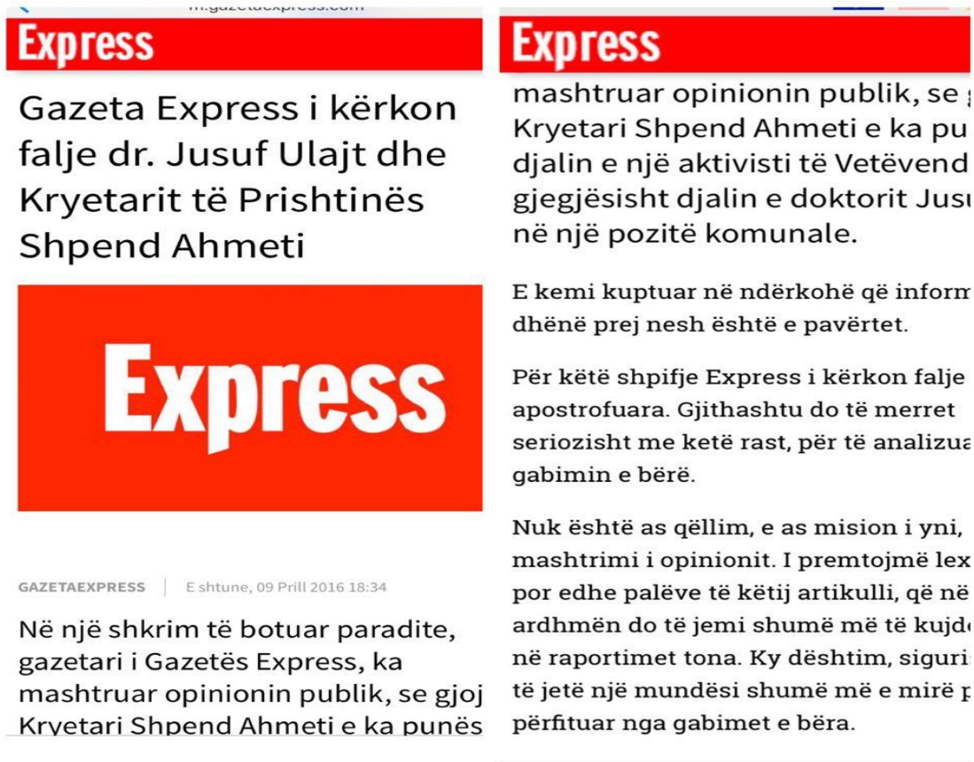
Figura 4: Kërkim falja nga drejtori i gazetës “express” për publikim e një lajmi të rremë