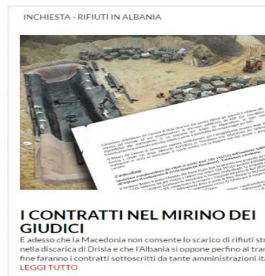
E adesso che la Macedonia non consente lo scarico di rifiuti stranieri nella discarica di Drisla e che l'Albania si oppone