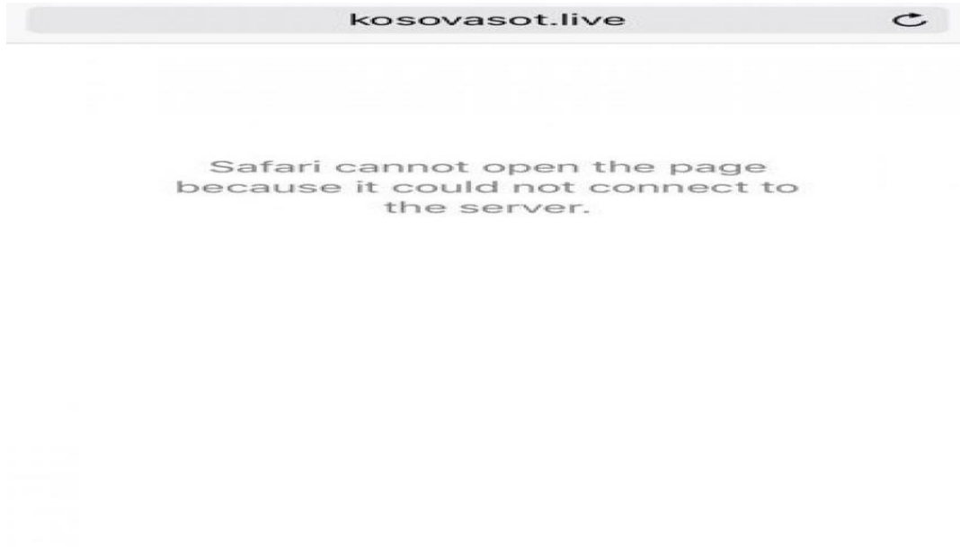
Figura 5: Mbyllja e portalit “fake news”, në Kosovë