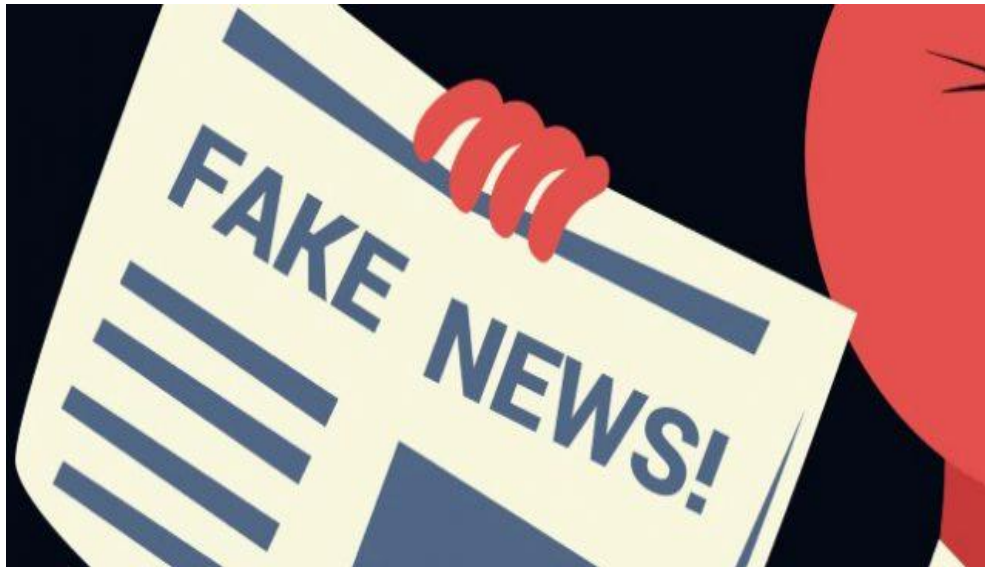
Figura 6: Ilustrim/dizajn “Fake News”

Franca, Gjermania si dhe Bashkimi Evropian, në bashkëpunim me kompanitë udhëheqëse të teknologjisë dhe mediave sociale, po ndërmarrin veprime kundër fenomenit të lajmeve të rreme.