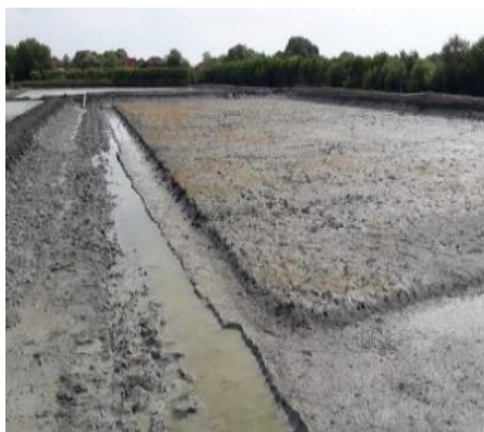
Gambar 2. Pengapuran dasar tambak

Pengerinan tanah dasar tambak penting dilakukan untuk menguraikan bahan organik yang menumpuk hasil dari aktivitas budidaya yang sebelumnya. Pengerinan tanah dasar ini dilakukan kurang lebih 1 bulan, sampai dengan tanah tersebut retak-retak. Gambar 1 adalah tambak yang sedang dilakukan pengerinan tanah dasar. Pengelolaan lahan dilakukan dengan tujuan untuk mendapatkan kualitas air yang optimal bagi organisme yang dibudidayakan. Pengerinan lahan selama 1 minggu untuk mengurai zat-zat beracun yang ada pada substrat tambak. Limbah budidaya yang berupa limbah organik dari sisa pakan, faeces udang dikeluarkan dari tambak dengan cara dicangkul dengan kedalaman 10-30 cm