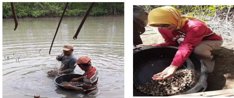
Gambar 5. Panen parsial kerang

Panen menunjukkan hasil yang memuaskan, walaupun sempat terkena banjir rob. dengan harga jual yang cukup tinggi (Tabel 4)