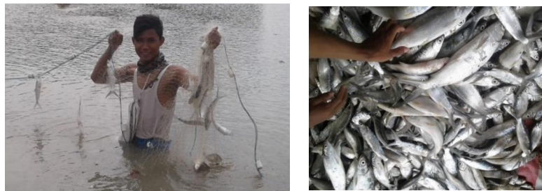
Gambar 4. Panen parsial bandeng