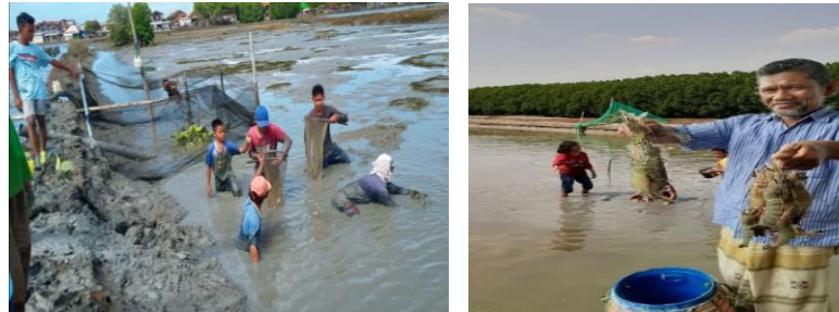
Gambar 3. Panen parsial udang

Panen udang dilakukan dengan mengurangi volume air tambak (Gambar 4). Sedangkan panen bandeng dilakukan dengan menggiring bandeng menggunakan jaring (Gambar 5). Panen kerang darah dilakukan dengan menyerok dasar tambak (Gambar 5). Rumput laut belum bisa karena ukuran biomasa masih belum memenuhi ukuran konsumsi dan harga masih rendah. Belum ada pembeli untuk rumput karena belum diminati konsumen dan produksinya masih sedikit. Harga pasar menentukan waktu pemanenan. Hasil panen secara keseluruhan tersaji pada Tabel 4.