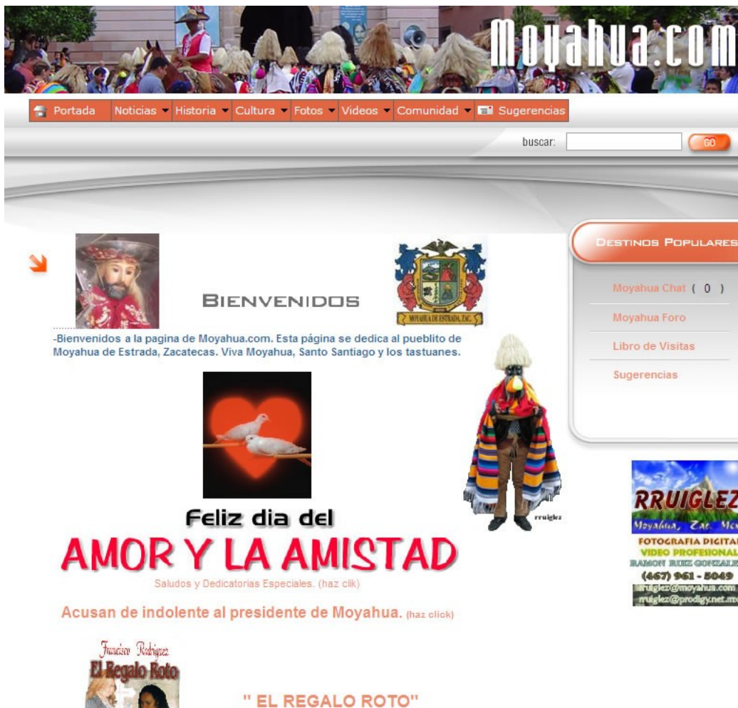
Fig. 6. Captura de pantalla del sitio Web de Moyahua, Zacatecas (clip_image005.jpg).

El sitio Web de Moyahua cuenta con varias secciones: la sección de Noticias la cual consta de varias sub-secciones similares a las encontradas en un periódico convencional: noticias locales, eventos, entrevistas, clima y deportes. Sin embargo, todas estas secciones tratan sólo asuntos locales. Hay otras dos secciones llamadas Historia y Cultura la cual provee información histórica, información acerca de gente sobresaliente de la comunidad así como también de festividades locales. De manera similar, cuenta con una galería de video y fotografías agrupadas en álbumes fijos creados por el webmaster. Por último, hay una sección llamada Comunidad la cual comprende el Chat, foros, directorio de usuarios, comercio local, escuelas locales, bares y otras comunidades vecinas.