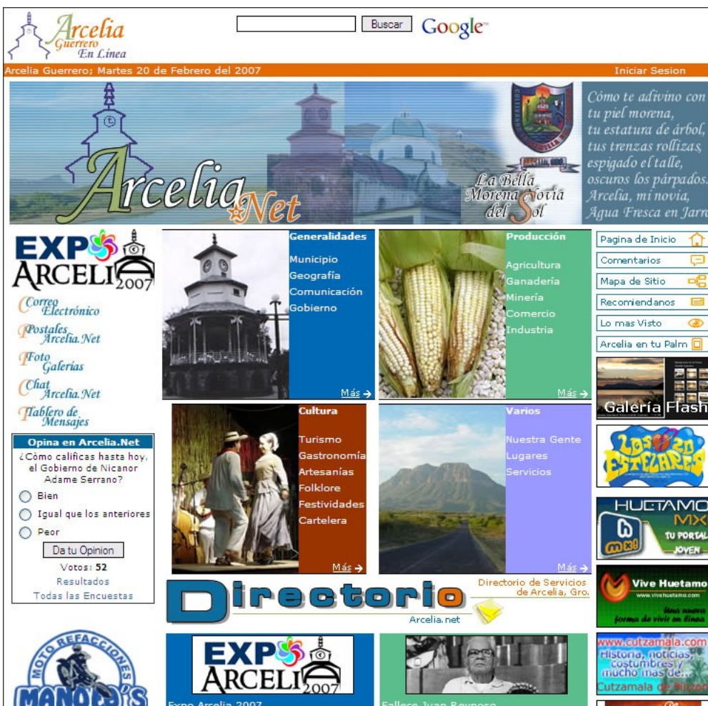
Fig 2. Captura de pantalla del sitio de Arcelia, Guerrero

Con respecto a la audiencia del sitio Web, parece que muchas de las personas acceden de manera diaria, tomando en cuenta el número de fotos publicadas y los mensajes cortos que se publican. Aunque el sitio ha sido visitado alrededor de 642,555 desde octubre de 2002, los números pueden ser poco engañosos ya que la compañía que lleva la cuenta de las visitas aumenta el número de visitas cada vez que se recarga la página, lo que significa que cada clic en el sitio incrementa el contador.