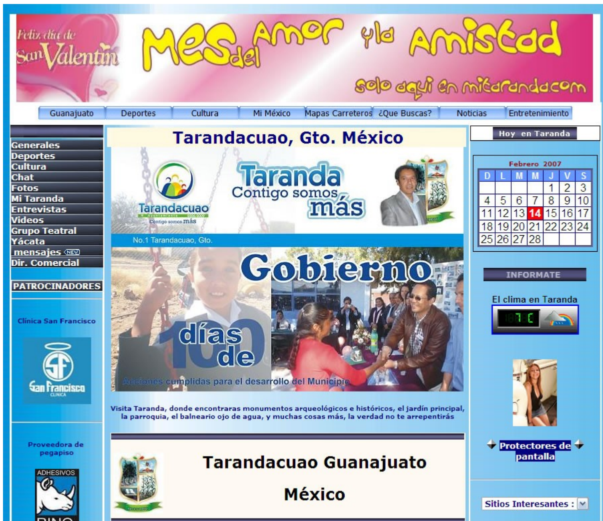
Fig. 1. Captura de pantalla del sitio Web de Tarandacuao, Guanajuato

MiTAranda.com (Figura 1) es un sitio Web que pone especial énfasis en informar a los usuarios sobre cuestiones locales. Así, tanto notas informativas como nuevas fotos son publicadas de manera frecuente. El sitio también ofrece entrevistas a personajes públicos de la comunidad y ofrece, además, enlaces a servicios municipales, estatales y federales. El sitio Web no usa programación para generar páginas dinámicas e interactivas. El sitio es administrado centralmente y actualizado por el webmaster, lo cual, ciertamente, lo hace menos dinámico. Las fotos publicadas son generalmente de personas que viven fuera de la comunidad y presenta además eventos sociales tales como bodas, además de fiestas o miembros de la comunidad cuando están visitando otros lugares. El sitio cuenta además con un Chat, el cual está hospedado en un servidor externo. Finalmente, también se publica información acerca de servicios en la comunidad (e.g. personas que pintan casas o con otros oficios).