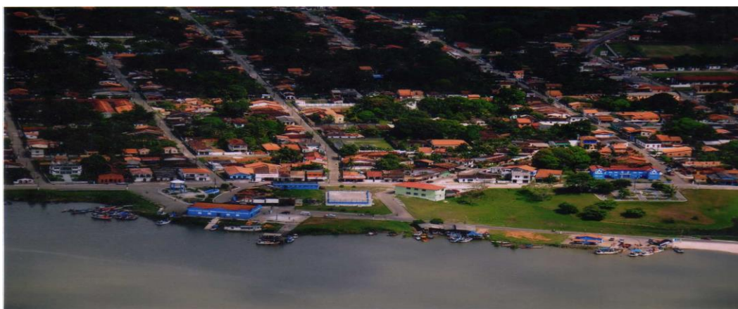
Figura 1 - Vista aérea de São Caetano de Odivelas, em primeiro plano o rio Mojuim - Pará, Amazônia

A coleta foi realizada no período de 6 a 10 de abril de 2020, com 20 moradores em razão de ser considerada cidade local (SANTOS, 2008), abrigar um núcleo de ensino e pesquisa da Universidade Federal do Pará (UFPA), com um curso de graduação em Letras, e ainda ser campo de investigações do Programa de Pós-Graduação em Estudos Antrópicos na Amazônia (PPGEAA/UFPA), ao qual se vincula o Colaboratório de Interculturalidades, Inserção de Saberes e Inovação Social (COLINS), grupo de pesquisa responsável por esta iniciativa. A cidade tem população de 18.050 habitantes (IBGE 2019), distribuídos em 631 domicílios (IBGE 2010), sendo esta a representatividade da pesquisa: pouco mais de 3% dos domicílios, aparentemente baixa, mas esta pesquisa é considerada inicial para a calibragem do público, dos instrumentos e das questões a serem respondidas, havendo necessidade de desdobramentos e ampliação da mesma. A cidade está situada na região costeira atlântica do Estado do Pará (Figura 1), na confluência do rio Mojuim (referenciado também como rio Bareto) com o rio Pará, em zona estuarina, dedicada principalmente à economia do pescado (peixes e caranguejos), com participação também de prestação de serviços comerciais e públicos, além do turismo ocasional de pesca esportiva.