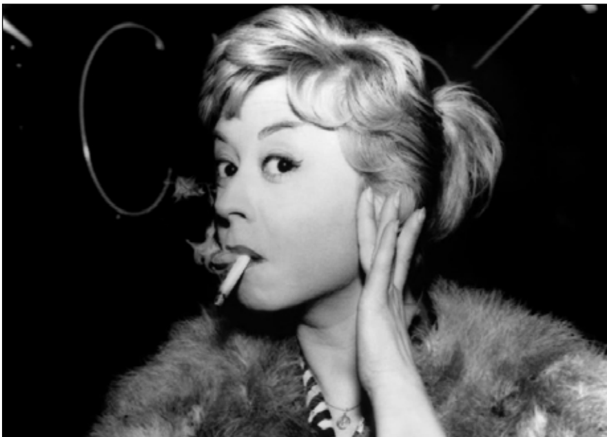
Le notti di Cabiria (Federico Fellini, 1957).

La película narra las noches de Cabiria y se pueden identificar algunas referencias al neorrealismo puro ya que utiliza la calle como escenario, el deseo por el cambio de vida que se refleja en el comportamiento de la protagonista y el contexto en que se da la historia: la falta de dinero durante la postguerra. Además, se evidencia en los personajes la inclinación de Fellini por el circo, como se puede notar en la presencia de personajes voluptuosos como Wanda, la "lady" del circo, la mujer de Oscar e inclusive él mismo. A su vez, rompe el plano en la escena en que todos agasajan a Cabiria y ella hace una señal de agradecimiento a todos, incluyendo al espectador. Con respecto al maquillaje de Cabiria, capta mucho la atención la forma de sus cejas hacia arriba, lo cual ayuda a su caracterización amarga durante el momento posterior a la traición de su ex por un asunto de dinero y el cambio de expresión cuando se enamora de Oscar, antes de su traición. (Melissa Castillejo)