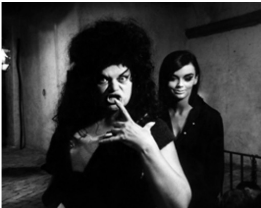
8 ½ (Federico Fellini, 1963).

La película carece de un final porque el proceso creativo no tiene fin. La necesidad de crear es abrumadora y es la fuente de los mayores gozos y temores. 8 ½ es desprendimiento personal y una muestra de amor al cine. (Yasmín Sayán)