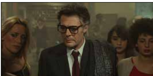
La città delle donne (Federico Fellini, 1980).