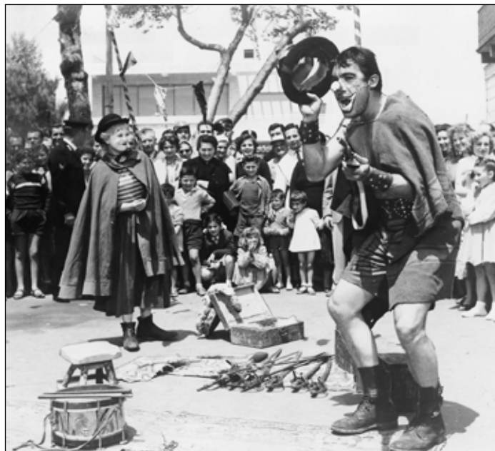
La strada (Federico Fellini, 1954).

La inercia de Gelsomina y la indolencia de Zampanó, en medio de la pobreza y de comidas mal preparadas por el camino, con ropajes rotos y haciéndole frente a la intemperie. El dolor magnificado y puesto en evidencia en una relación en la que ambos sufren, con la única diferencia de que ella se expone mientras él impone. La operística del neorrealismo en dos personajes tan drásticamente diferentes y tan claramente identificables. Porque la salvación de Gelsomina está en el loco bufón que, así como ella, es presa del infortunio de la casualidad. Menudo y pequeño, basa sus ánimos de supervivencia en su propia gracia y se convierte en el espejo de esta pobre mujer vendida por unas cuantas liras a un fenómeno de circo alto, fuerte y orgulloso de una hombría que impone a fuerza de gritos y golpes. Pero el payaso que configura Gelsomina esconde la desesperación de no saber cuál es el lugar que el destino le ha encomendado: ser niña desconsolada o mujer siempre sumisa. (CPD)