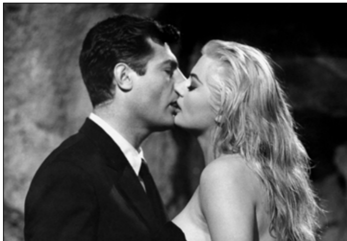
La dolce vita (Federico Fellini, 1960).