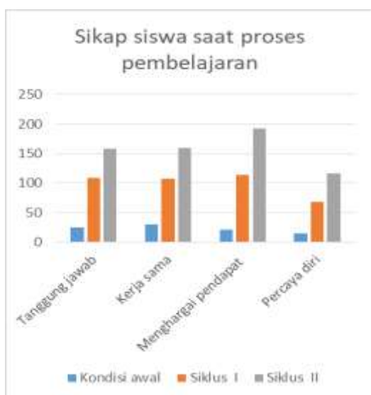
Gambar 2. Grafik hasil pengamatan sikap siswa saat proses pembelajaran

Berdasarkan hasil penilaian materi Persamaan garis lurus, siswa kelas VIII E SMP 3 Bae Kudus semester I tahun 2019/2020 juga menunjukkan hasil belajar yang rendah. Nilai rata-rata ulangan materi Persamaan Garis Lurus hanya sebesar 54 masih dibawah KKM yaitu 67. Dari 28 siswa masih terdapat 19 siswa yang mendapat nilai dibawah KKM dan 9 siswa yang mendapat nilai sama dengan atau lebih dari KKM. Ini berarti pada kondisi awal hanya 32% siswa yang tuntas dalam pembelajaran. Dengan nilai terendah 16, nilai tertinggi 90, nilai rata-rata 54, rentang 74.