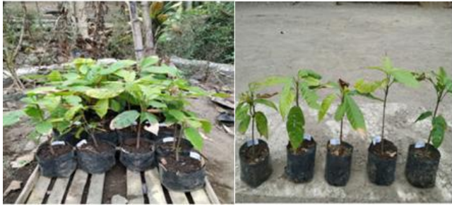
Gambar 5. Tanaman yang akan diaplikasikan pupuk formula cair P. fluorescens

Setelah aplikasi selama 8 minggu maka dilakukan pengamatan akhir pertumbuhan tanaman. Pengamatan yang dilakukan meliputi pengukuran tinggi tanaman, panjang akar, diameter daun dan bobot kering tanaman. Hasil yang didapatkan sebagai berikut: