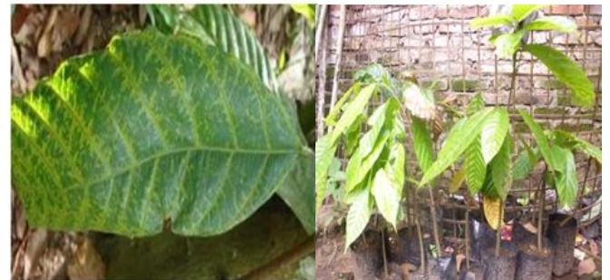
Gambar 4. Bibit tanaman tanaman kakao yang akan diberikan perlakuan formula cair Pseudomonas fluorescens .

Berdasarkan pengamatan kondisi lapangan di perkebunan dimana banyak tanaman terserang CSSV dan gejala dapat diamati mulai dari daun, buah dan batang. Maka dari tanaman yang terinfeksi inilah yang akan digunakan untuk menghasilkan bibit kakao pada penelitian ini. Pada penelitian ini diambil biji dari buah kakao yang memiliki gejala terserang CSSV ditumbuhkan dalam polybag. Pengamatan gejala mosaik dari bibit tanaman terinfeksi ini dilakukan ketika tanaman sudah memiliki lebih dari 3 helai daun bergejala. Sampai saat ini tanaman telah mencapai tinggi 30 cm setelah 3 bulan dilakukan penanaman.