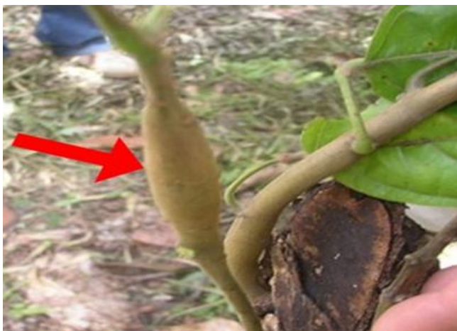
Gambar 3. Batang tanaman kakao yang mengalami pembengkakan (swollen) karena terinfeksi virus

Gejala mosaik dari tanaman kakao juga ditemukan pada buah dan biji kakao. Pada tanaman yang sehat akan memiliki buah yang sehat pula, artinya tidak ada gejala terinfeksi virus. Penampakan buah kakao memiliki kulit halus dan biji kakao berdaging buah warna putih dan antar biji tidak saling melekat. Sementara itu pada tanaman yang terinfeksi virus, kulit buah kakao terlihat berkerut dan mengalami nekrosis. Ketika buah kakao dibelah akan tampak biji kakao yang berwarna hitam dan antar biji saling melekat. Tanaman kakao yang terserang virus juga dapat dilihat dari adanya pembengkakan pada bagian batang kakao (Gambar 3). Batang tanaman kakao yang membengkak ini akibat terserang Cacao swollen shoot virus.