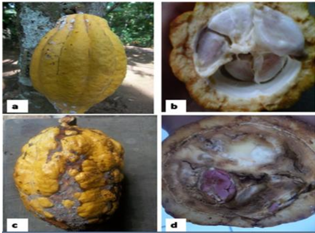
Gambar 2. Buah kakao yang sehat dan terinfeksi penyakit mosaik. a dan b) buah kakao yang tidak terinfeksi virus dan biji kakao yang sehat berwarna putih c, d) buah kakao yang terinfeksi virus dan biji kakao terinfeksi virus berwarna hitam.

Gejala mosaik dari tanaman kakao juga ditemukan pada buah dan biji kakao. Pada tanaman yang sehat akan memiliki buah yang sehat pula, artinya tidak ada gejala terinfeksi virus. Penampakan buah kakao memiliki kulit halus dan biji kakao berdaging buah warna putih dan antar biji tidak saling melekat. Sementara itu pada tanaman yang terinfeksi virus, kulit buah kakao terlihat berkerut dan mengalami nekrosis. Ketika buah kakao dibelah akan tampak biji kakao yang berwarna hitam dan antar biji saling melekat. Tanaman kakao yang terserang virus juga dapat dilihat dari adanya pembengkakan pada bagian batang kakao (Gambar 3). Batang tanaman kakao yang membengkak ini akibat terserang Cacao swollen shoot virus.