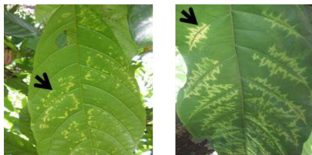
Gambar 1. Identifikasi gejala penyakit mosaik pada daun kakao di perkebunan kakao

Pertama dilakukan survey di perkebunan kakao milik rakyat di desa Banjaroya, Kalibawang Kulonprogo Yogyakarta. Hasil survey lokasi didapatkan kebun kakao klon Djati Runggo 1 (DR1) yang sebagian besar terserang penyakit mosaik. Menurut Probowati dkk, 2019 klon DR1 yang memiliki gejala mosaik pada daunnya ini terbukti terserang Cacao swollen shoot virus (CSSV). Gejala secara jelas tampak pada daun kakao. Umur tanaman ini sekitar 15 tahun. Dari pohon-pohon inilah diandalkan produksi buah kakao yang dimanfaatkan bijinya untuk membuat makanan coklat.