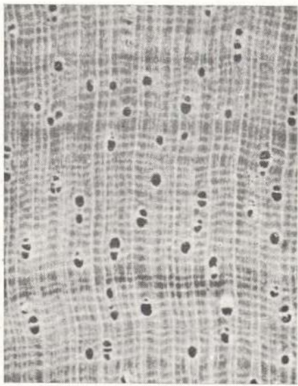
Fig. 4 — Aspecto macroscópico da madeira de Micrandra scleroxylon W. Rodr. n. sp., em seção transversal com 10X de aumento. (W. Rodrigues & A. Loureiro, 7065)

predominantes e múltiplos até 5, vazio a maioria no albúrnio e geralmente obstruídos no cerne; raios muito finos, numerosos (3-7 por mm) com certa uniformidade no espaçamento e espessura, distintos apenas sob lente no tampo, na face tangencial irregularmente dispostos, pouco distintos sob lente, na face radial contrastados por linhas mais escuras; linhas vasculares finas e longas; camadas de crescimento demarcadas por zonas e fibras mais escuras.