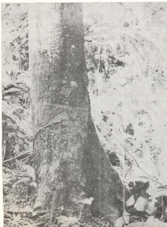
Fig. 3 — Base do tronco de Micrandra scleroxylon W. Rodr. n. sp'

Raízes tabulares grandes não foram vistas na espécie. Em geral as raízes são axonomorfas.