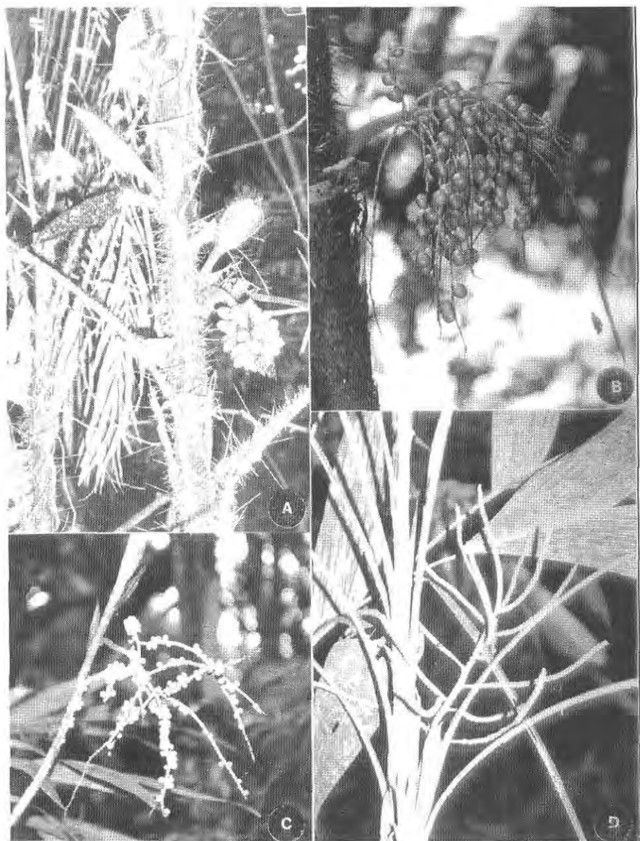
Figura 3. Palmeiras do Parque Nacional do Seringueiro. A. Bactris concinna ; B. Bactris brongniartii ; C. Geonoma deversa ; D. Geonoma juruana .