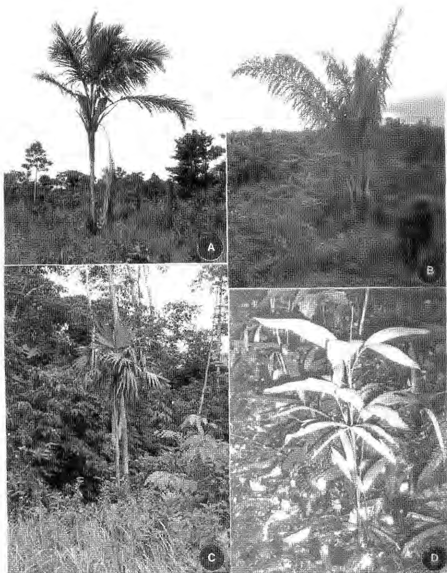
Figura 2. Palmeiras do Parque Natural do Seringueiro. A. Astrocaryum aculeatum ; B. Maximiliana maripa ; C. Chelycarpus chuco (observar as folhas com peciolo muito curto); D. Bactris simplicifrons .