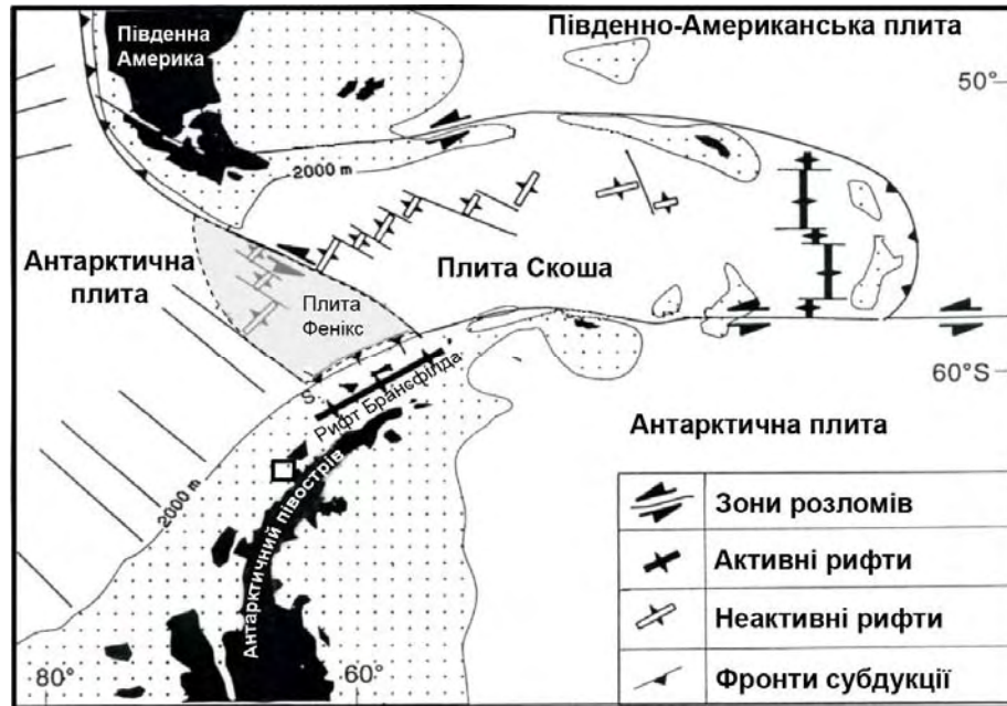
Рис. 3. Тектонічна карта Антарктичного півострова та моря Скоша за даними Лартера та Баркера [Larter, 1991]. Квадратом позначено територію досліджень

З погляду регіонального впливу на геодинаміку досліджуваної території потрібно відзначити два фактори. Це, по-перше, близьке розташування (північно-західніше) активної рифтової зони Брансфілда (рис. 3), де відбувається інтенсивне розширення та формування нової океанічної земної кори, яке, своєю чергою, спричиняє аналогічне розширення виділеної нами локальної горстової структури.