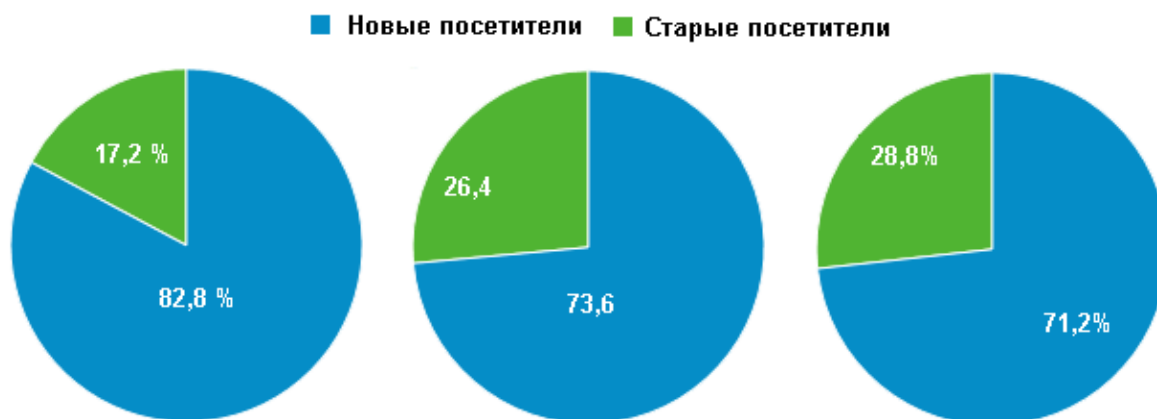
Таблица 8. Рост повторных посещений

С помощью Google Analytics, к которой подключена NASPLIB, можно получать различные статистические данные использования нашей ЭБ. Далее приводятся некоторые из них, представленные в графическом виде.