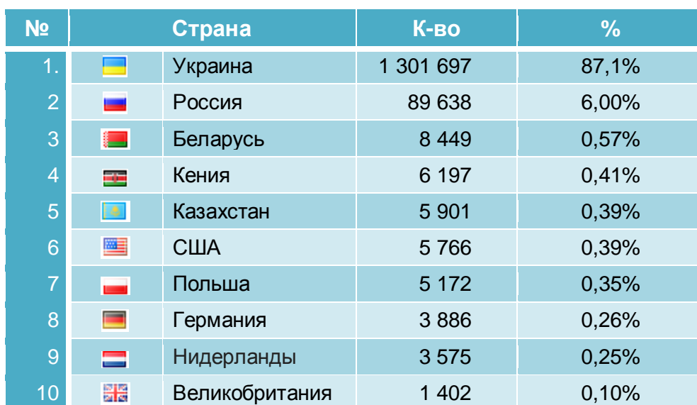
Таблица 9. 10 наиболее посещаемых стран

Страны посещений. Что касается стран посещений, то в приведенной ниже таблице приводится 10 наиболее посещаемых стран за все время сбора статистики с указанием общего количества посещений и процента посещений от общего количества посещений.