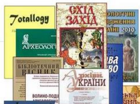
Рис. 3. - 3 091 961 просмотров и 4 437 724 скачиваний статей отделения Истории, философии и права