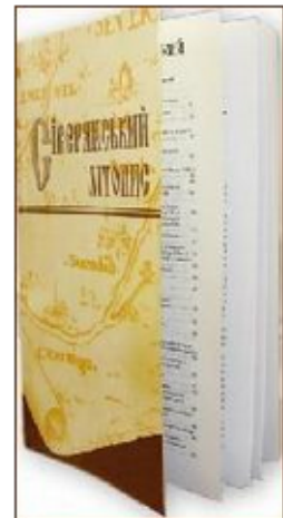
Рис. 4. - 189 089 просмотров и 245 190 скачиваний статей журнала «Сіверянський літопис»