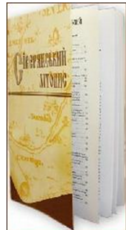
Рис. 4. - 189 089 просмотров и 245 190 скачиваний статей журнала «Сіверянський літопис»