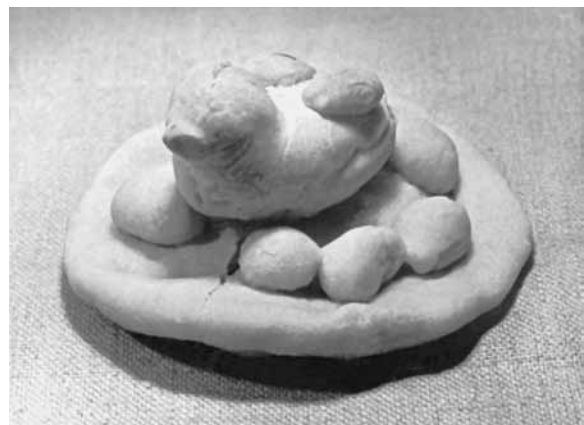
Обрядове весняне печиво «гніздо». Підляшшя. Архів ІМ ПАН. 1965

Серед українців Подляшшя, Полісся, Поділля ще наприкінці ХІХ ст. і до середини ХХ ст. побутував архаїчний звичай випікати перед Благовіщенням (7 квітня) прісне печиво «буслові лапи», яке часто мало форму лап лелеки, а також своїм виглядом нагадувало борону, плуг, серп, пташине гніздо, що свідчить про давню дохристиянську аграрну символіку. Таке печиво, яке називали ще «галепи», давали дітям, які вибігали з ним на подвір'я зустрічати приліт бусла (лелеки). Побачивши птаха в небі, піднімали печиво й вигукували: «Буську, буську, на тобі галепу, дай мені жита копу! Буську, буську, на тобі борону, дай мені жита сторону! Буську, буську, на тобі серпа, дай мені жита снопа!». На Поділлі підносили вгору шматок хліба чи коржик, а тексти примовлянь були ідентичними до поліських. Учені вбачають у цих архаїчних пережитках звичаю випікання обрядового благовіщенського печива символічні дії, спрямовані на зародження життя на землі (бо лелека приносить нове життя), культурний обробіток ґрунту (борона) і збирання врожаю (серп) 9 .