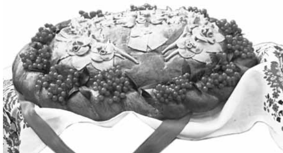
Коровай. м. Біла Церква, Київщина. 2004

У минулому цей обрядовий хліб виконував, очевидно, і певну правову функцію. Адже коровай виготовляли лише з нагоди першого одруження, удовам і вдівцям його не випікали; гостину ж при укладанні шлюбу без короваю вважали не весіллям, а вечіркою. Важливим аргументом на користь правової функції короваю є відомості, що в минулому його готували родичі молодих. Як відгомін родових відносин,