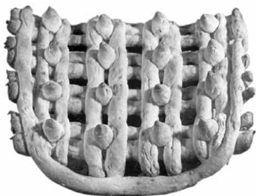
Весняне печиво «борона». с. Андріянка, Підляшшя. Архів ІМ ПАН. 1965. Світлина Я. Свідерського

ного календаря та сімейного циклу. Культ хліба з глибокою символікою особливо був характерний для свят Різдвяного циклу. Тут простежується дуже архаїчний елемент використання зерна в необмолоченому снопі — дідухові, засівання зерном на Василя (14 січня). Окрім цього, давньою поминальною стравою із зерна є кутя-коливо на Святвечір, в основі якого — пошанування пращурів для забезпечення добробуту і щасливого року. Єднання родових зв'язків відбувалося й через ряд спеціальних обрядових хлібів: книші, книшики, крачун, колачі (калачі) тощо. Книш — це звичайна кругла хлібина, що іноді мала невеличку булочку зверху, яку називали «душею». За польовими експедиційними матеріалами та описами дослідників, «книші вироблялися так: вироблявся хліб, звичайний, а зверху наклали маленьке хлібнятко, що називали його «душею» — це саме для духів чи, як казали, для душі» 2 . Більші та менші книші ставили на покуті поряд з узваром та кутею, ними обдаровували посівальників, щедрувальників. Це підтверджено й іншими дослідниками на основі сучасного етнографічного матеріалу. Зокрема, на Буковині побутує звичай, коли тісто на книші замішують разом чоловік із дружиною. «Книші вироблялися як звичайний хліб, а зверху клали маленький хлібець, який звали душею. У приготуванні книшів відображено культ предків, який виник ще за первісних часів, коли людина глибоко вірила,