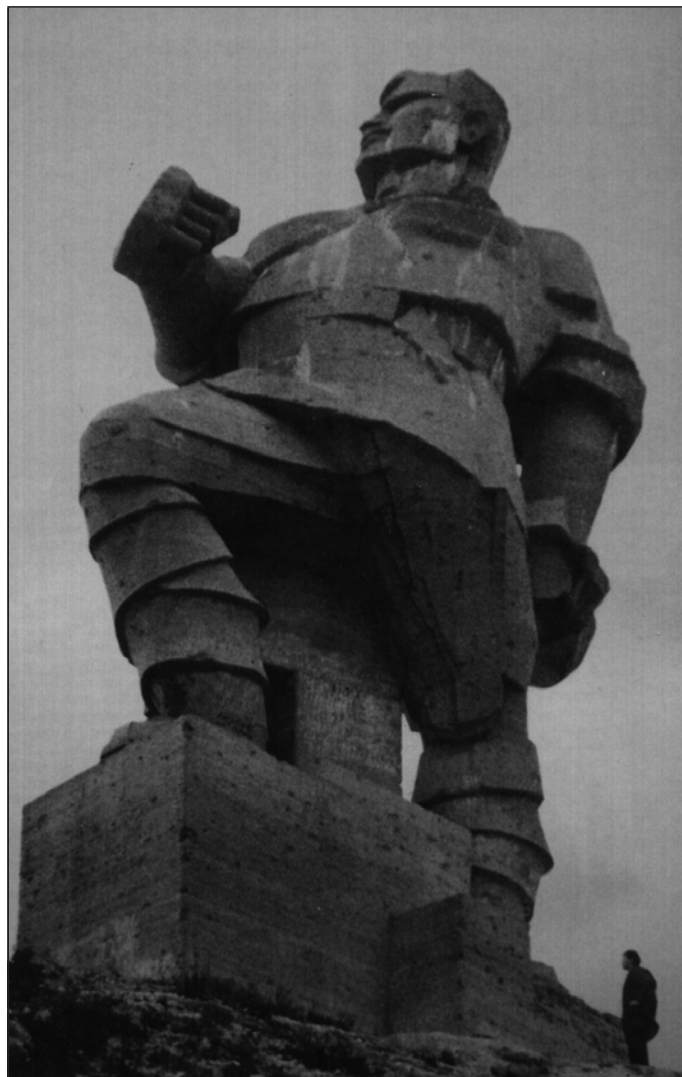
Пам'ятник Артему у Слов'яногорську

Петро, хоча й був міцного здоров'я, захворів на сухоти і 1905 року помер... А коли в 1918 році більшовики склали список революціонерів, яким треба встановити пам'ятники, Ленін викреслив ім'я Запорожця з цього списку... Ось чому пам'ятник Петру Запорожцю в Білій Церкві роботи Кавалерідзе, який готували до 100-ї річниці з дня народження Петра