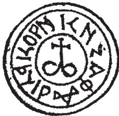
Рис. 3. Печатка князя Федора Дмитровича 39 .