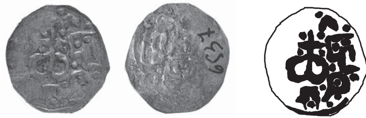
Рис. 2. Фото та прорисовка сторони зі знаком (аверса) монети князя Дмитра-Корибута Ольгердовича (1381–1404) 8 .