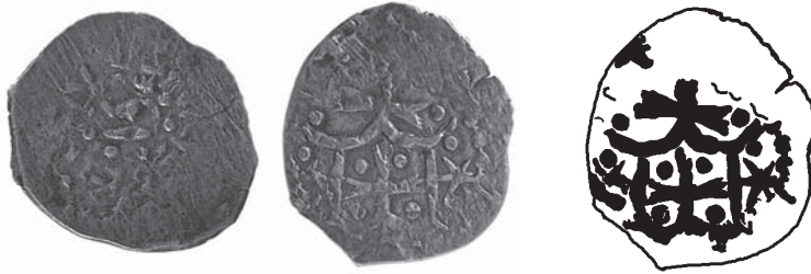
Рис. 1. Фото та прорисовка сторони зі знаком (аверса) монети князя Володимира Ольгердовича (1363–1394) 37 .