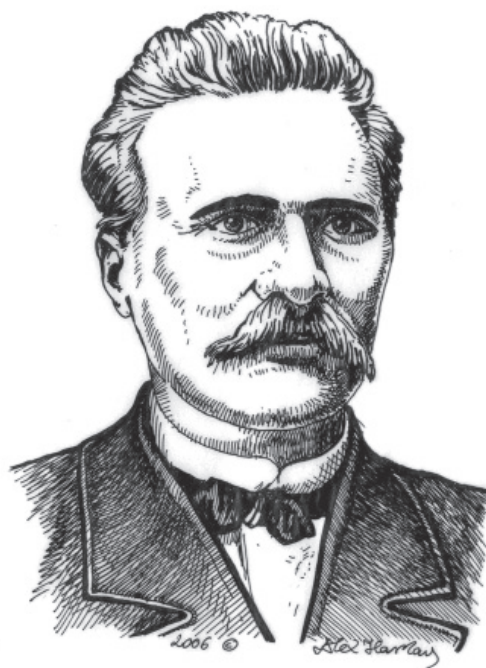
Мал. 4. Д. І. Яворницький. Малюнок автора 2006 р.