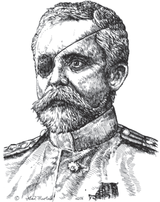
Мал. 6. В. Д. Машуков. Малюнок автора 2006 р.