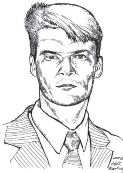
Мал. 11. І. І. Лиман. Малюнок автора 2008 р.