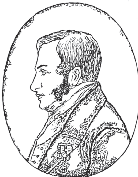
Мал. 2. А. О. Скальковський. Прорис автора 2006 р.