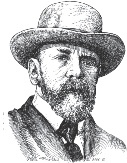
Мал. 8. В. В. Суслов. Малюнок автора 2006 р.