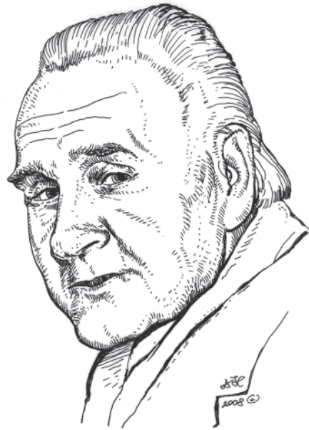
Мал. 10. В. В. Чепелик. Малюнок автора 2008 р.