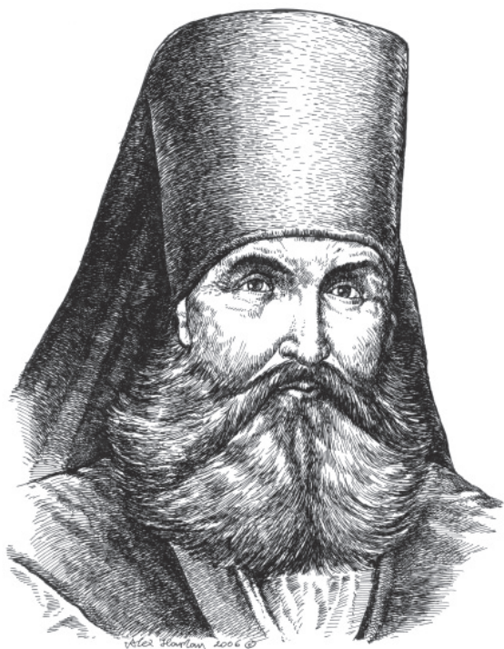
Мал. 3. Феодосій Макаревський. Малюнок автора 2006 р.