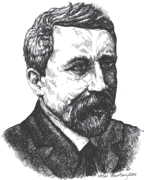
Мал. 7. Є. К. Редін. Малюнок автора 2006 р.