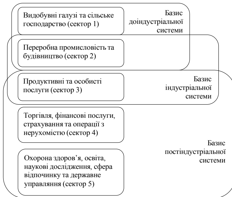
Рис. 1. Трансформація базисних секторів суспільного виробництва