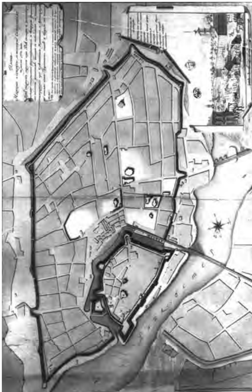
План Ніжина (Нового замку і Старого міста) та найближчої околиці (форштатів) 1773 р. Окрім елементів фортифікації, вулиць, міських кварталів і торгових лавок, на плані також позначено контури капітальних споруд Ніжина того часу – храмів і кам'яниць цивільного призначення