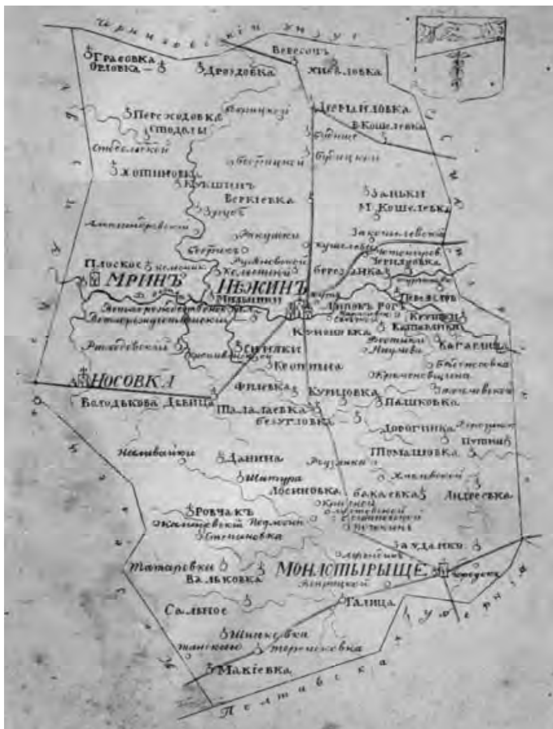
Карта Ніжинського повіту середини XIX ст.