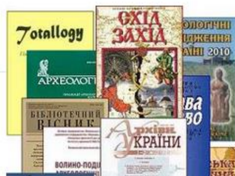
Рис. 3. - 3 091 961 просмотров и 4 437 724 скачиваний статей отделения Истории, философии и права