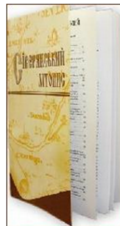
Рис. 4. - 189 089 просмотров и 245 190 скачиваний статей журнала «Сіверянський літопис»