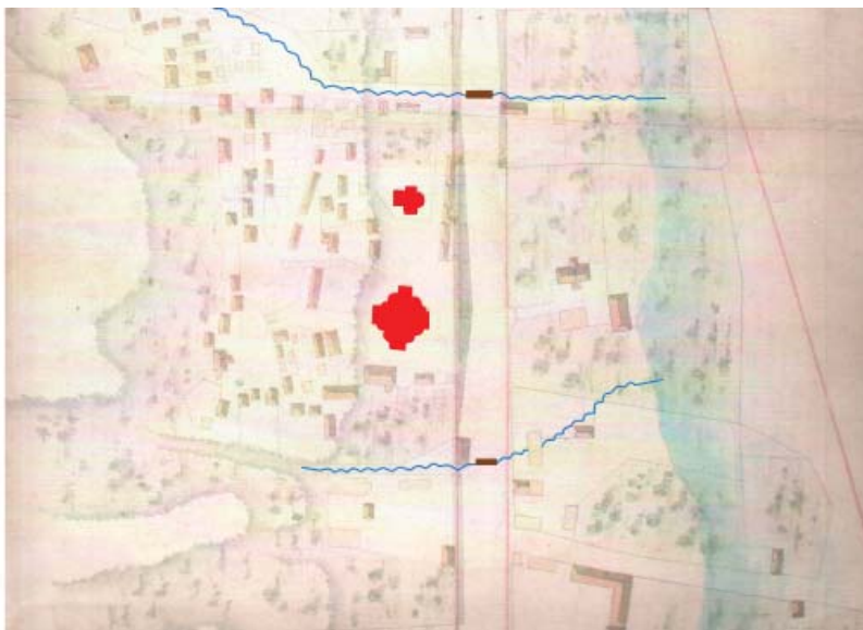
Мал. 3. Йорданський монастир у 1833 р.

Останній етап існування церкви Миколи Йорданського склався наступним чином. Наприкінці XIX ст. на дерев'яна церковна споруда була розібрана і на її місці спорудили цегляну однойменну церкву, яка проіснувала до 1930-х рр. Зараз визначити, де саме під Богословською горою у другій половині XVII–XIX ст. розташовувалась невелика Йорданська обитель, не представляється можливим: там розташована «промзона», русла колишніх ручаїв засипані, а рельєф з часу складання планів 1816 та 1833 рр. значно змінився внаслідок людської діяльності.