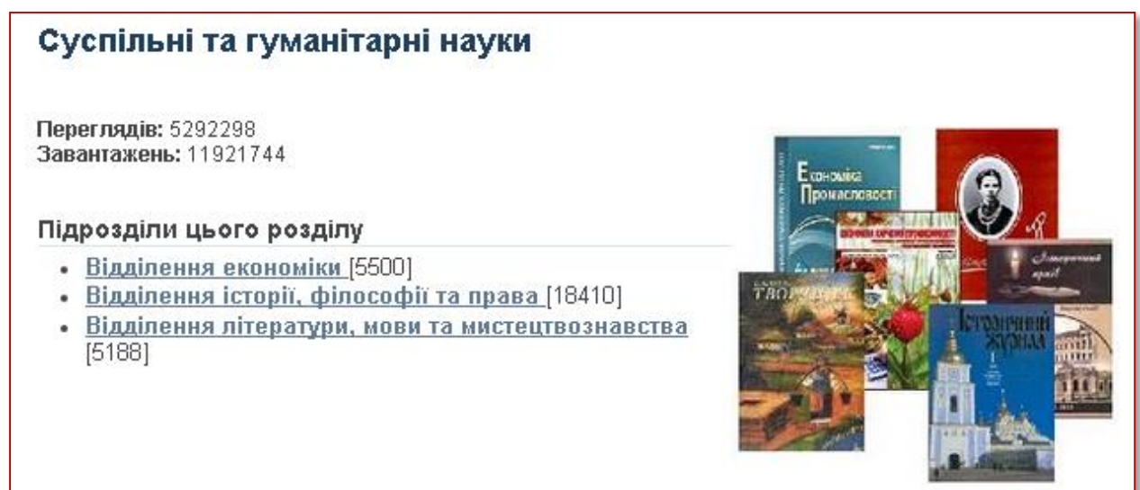
Рис. 2. - 5 292 298 просмотров и 11 921 744 скачиваний статей секции Общественных и гуманитарных наук.

В целом за весь период сбора статистики было произведено около 13.000.000 просмотров и около 23.000.000 скачиваний статей. Ниже приводятся примеры представления этой информации.