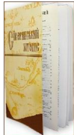
Рис. 4. - 189 089 просмотров и 245 190 скачиваний статей журналу «Сіверянський літопис»