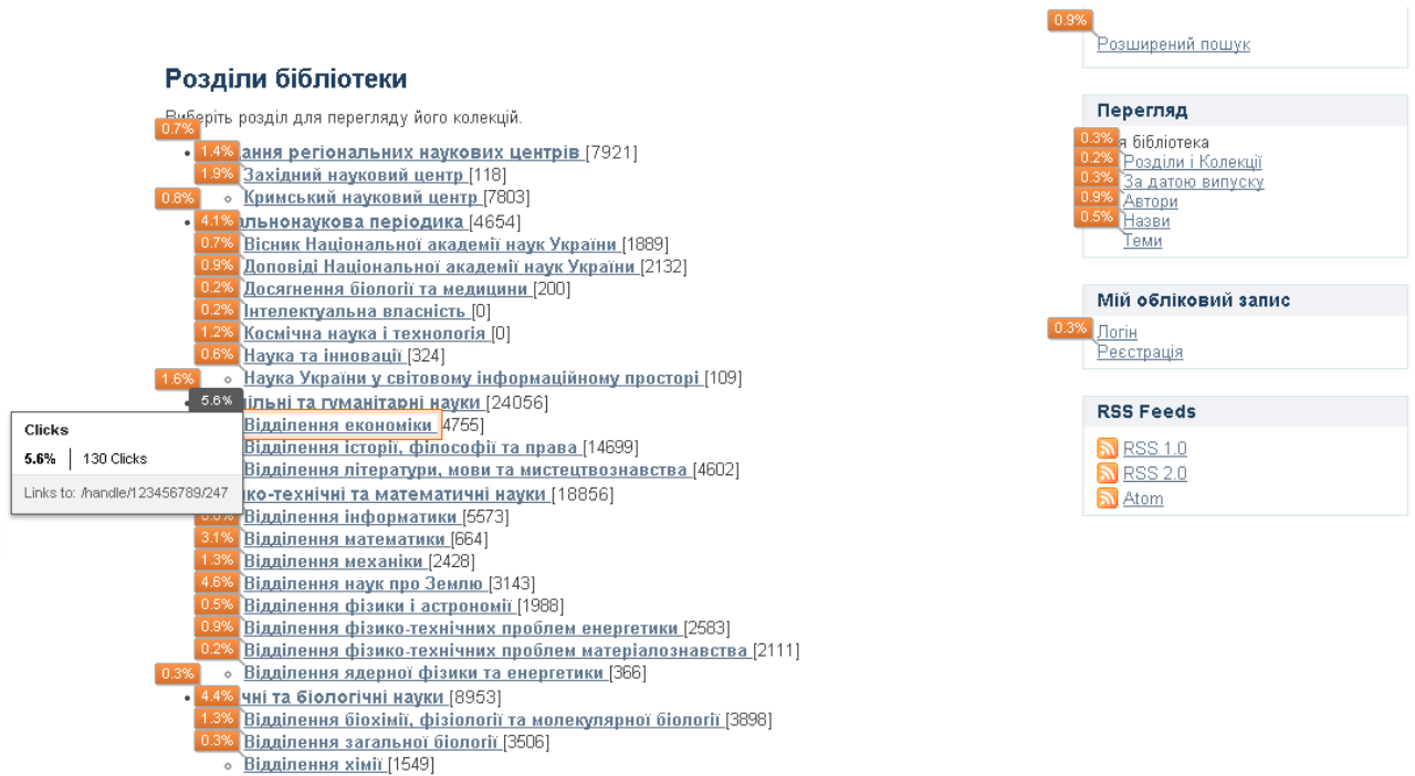
Рис. 1. Посещаемость домашней страницы NASPLIB