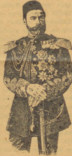
Ahmet Muhtar Paşa askeri kıyafetiyle

Karargâhı Erzurum'da olan Gazi Ahmet Muhtar Paşa, Kars kalesinin müdafaasını Hüseyin Hami Paşaya bırakmıştı. Haziran başında başlayan Rus kuşatması temmuzun onuna kadar devam etti. Nihayet bu muhasarayı terk ederek çekilmek zorunda kalan Ruslar, kahraman Kars'ı alamıyacıklarını anlamışlardı. Bu sırada Rumeli'deki Türk orduları da Pilevne'de Gazi Osman Paşanın