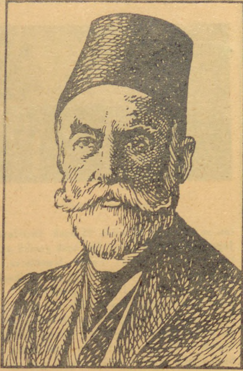
Gazi Ahmet Muhtar Paşa