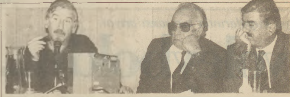
Nadir Nadi 80 Yaşında — 7. TÜYAP Kitap Fuarı'nın dünkü söyleşişi Nadir Nadi'ye ayrıldı. Büyük bir dinleyici topluluğunun katıldığı 'Nadir Nadi 80 Yaşında' konulu söyleşiye İlhan Selçuk ve Yaşar Kemal katıldı.

NADİ — Ödül beni çok mütehasis etti tabii. Ben layık değilim buna, ama işte ödülüdür, çok sevindim.