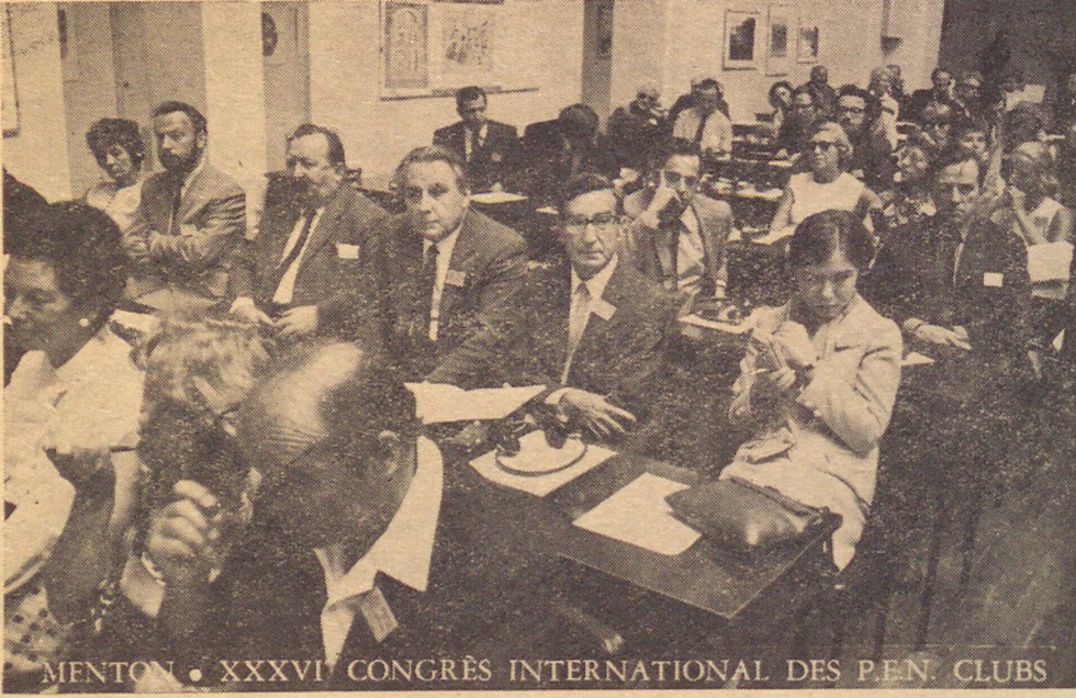
Menton Pen Kongresi, 1969

Oralarda Atatürk'ü görünce nasıl heyecanlanırdım! Halâ o anlar gözlerimin önünden gitmez. Yanına yaklaşırdım, gerçi tanışamadım, ne yazık ki kimse takdim etmedi; dinlerdim büyük ÖNDERİMİZİN konuşmalarını.