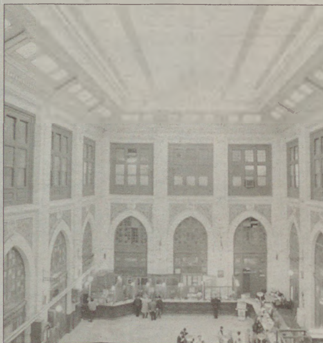
Osmanlı Geç Dönem mimarlığının en karakteristik örneklerinden biri olan Büyük Postane Vedad Tek'in adı ve kimliği ile bütünleşmiştir.

Mimari dönemlere ait monografiler çok eksik, böyle olunca da tıpkı milli mimarının genellemeci söylemine benzer biçimde, bütün mimari dönemlere ait ister istemez genelleştirici söylemlere giriyoruz. Bunu bizim bir eksiklik olarak görüyorum. Bu eksik aşılabilmesi için monografik etüdlerin sayıca çoğaltılması ve dönem hakkındaki değerlendirmelerde daha emin, güvenli bilgi tabanına oturması gerektiğini düşünüyorum. ■