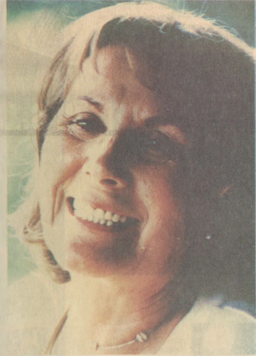
Adalet Ağaoğlu, 50 yılı aşkın bir yazarlık kariyerine sahip...