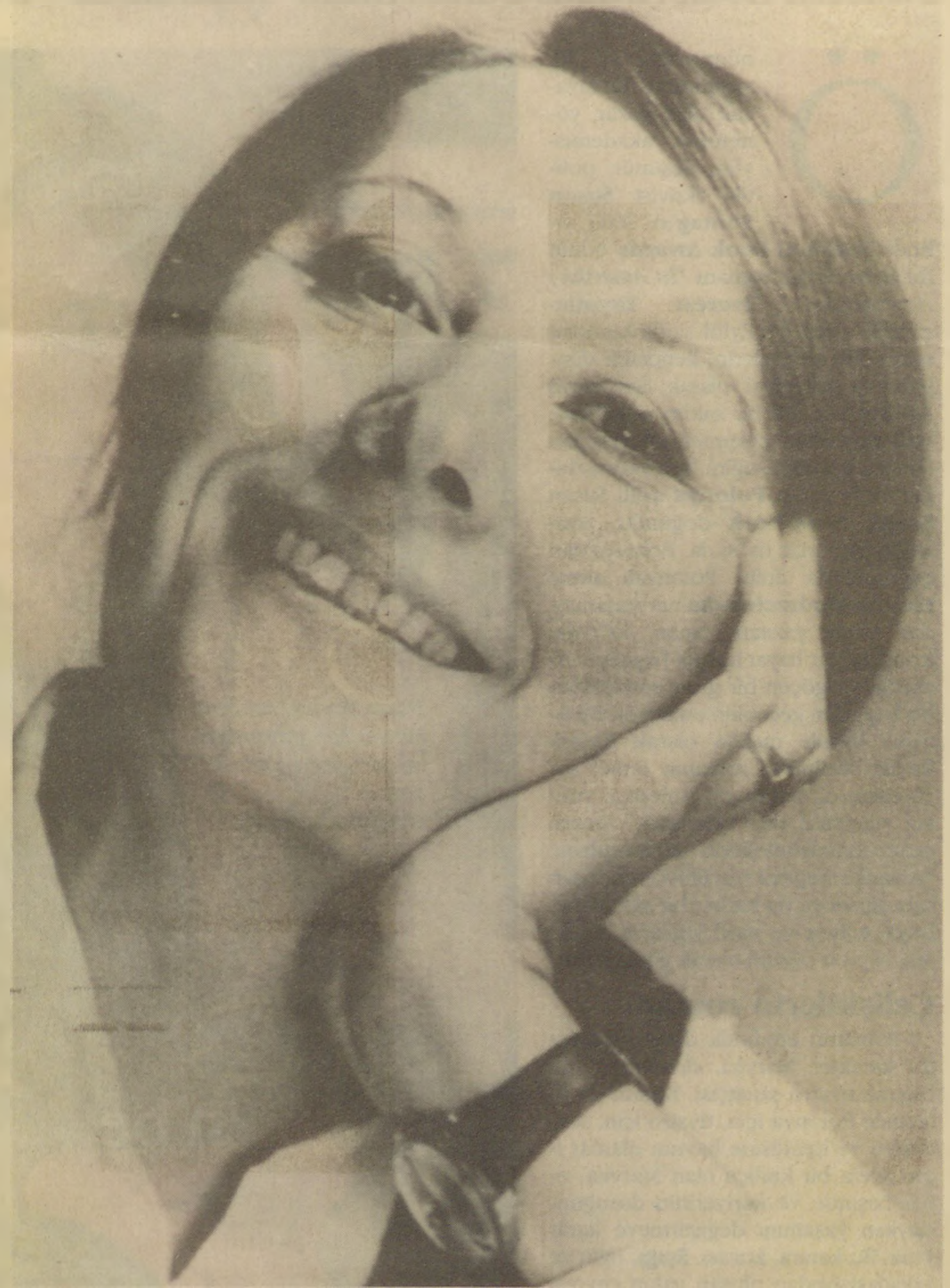
Çağdaş yazının olanaklarının yakın takipçisi ve uygulayıcısı Adalet Ağaoğlu'nun Yapı Kredi Yayınları'ndan yeniden basılan kitapları (altta).