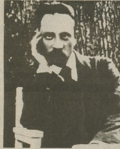
Rainer Maria Rilke