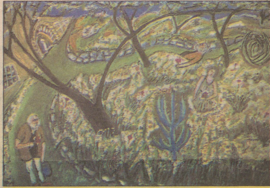
İlkbaharda Can eve geliyor.