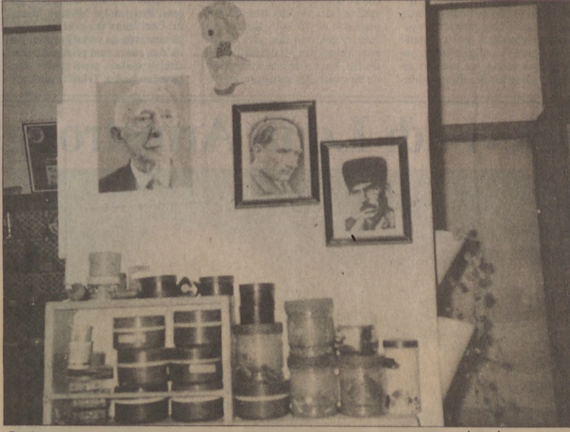
Bandırma ve çevresindeki bazı köylerde bazı hayvanları ve evlerin duvarlarını Mustafa Kemal ve İsmet İnönü'nün fotoğraflarının yanı sıra Çerkes Ethem'in fotoğrafları da süslüyor. Çerkes toplumu Ethem'i gönlünde yaşatmaya devam ediyor.

Ankara Hükümeti'nin oluştuğu, Kurtuluş Savaşı yıllarında Eaver Paşa yurt dışındadır. 1917 Rus Devrimi Türk aydınları ve İttihatçılar üzerinde büyük etki yaratmış-