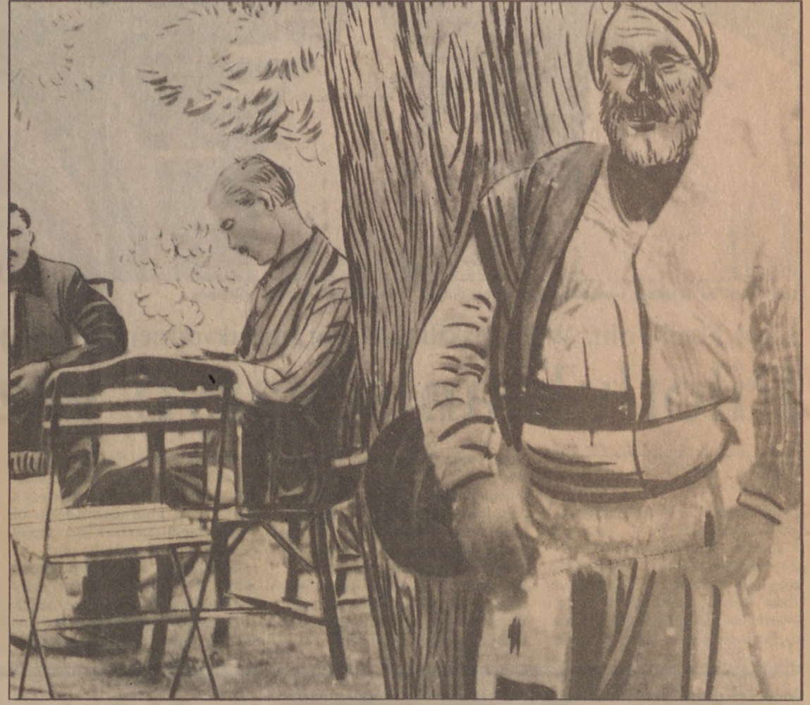
Çerkes Ethem'e ait çok eski bir fotoğraf. Ethem bir dinlenme sırasında bir ağacın dibinde gölgeleniyor. Yaşlı bir Çerkes ise ayakta onu bekliyor. (Not: Fotoğrafın solan yerlerinin üzerinde kalemle rötuş yapılmıştır.)

Çerkes Ethem'in Yozgat İsyanı'nı çok başarılı ve aynı derecede hızla bastırması Ankara'da bayram havası estirir. Artık Ethem'e bazı