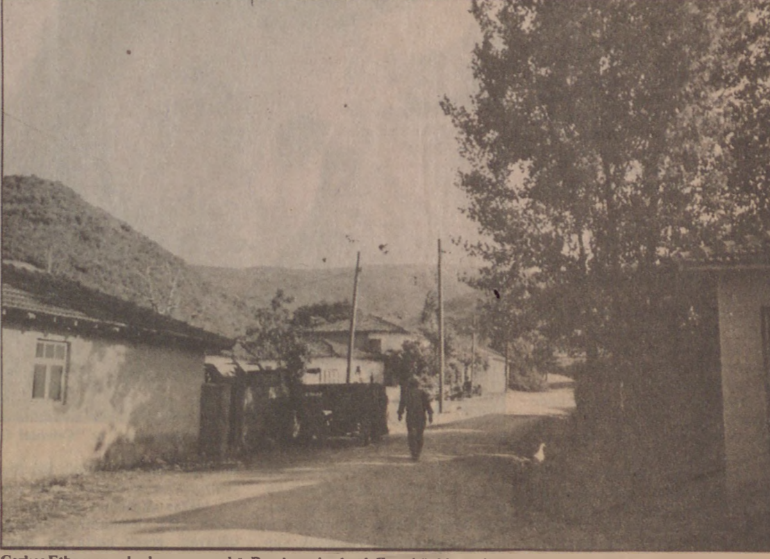
Çerkes Ethem ve yakınlarının yaşadığı Bandırma'ya bağlı Emreköy'de o yıllardan kalma birkaç ev hâlâ ayakta. Bunlar arasında Ethem ailesine ait evler de bulunuyor (soldaki evler).