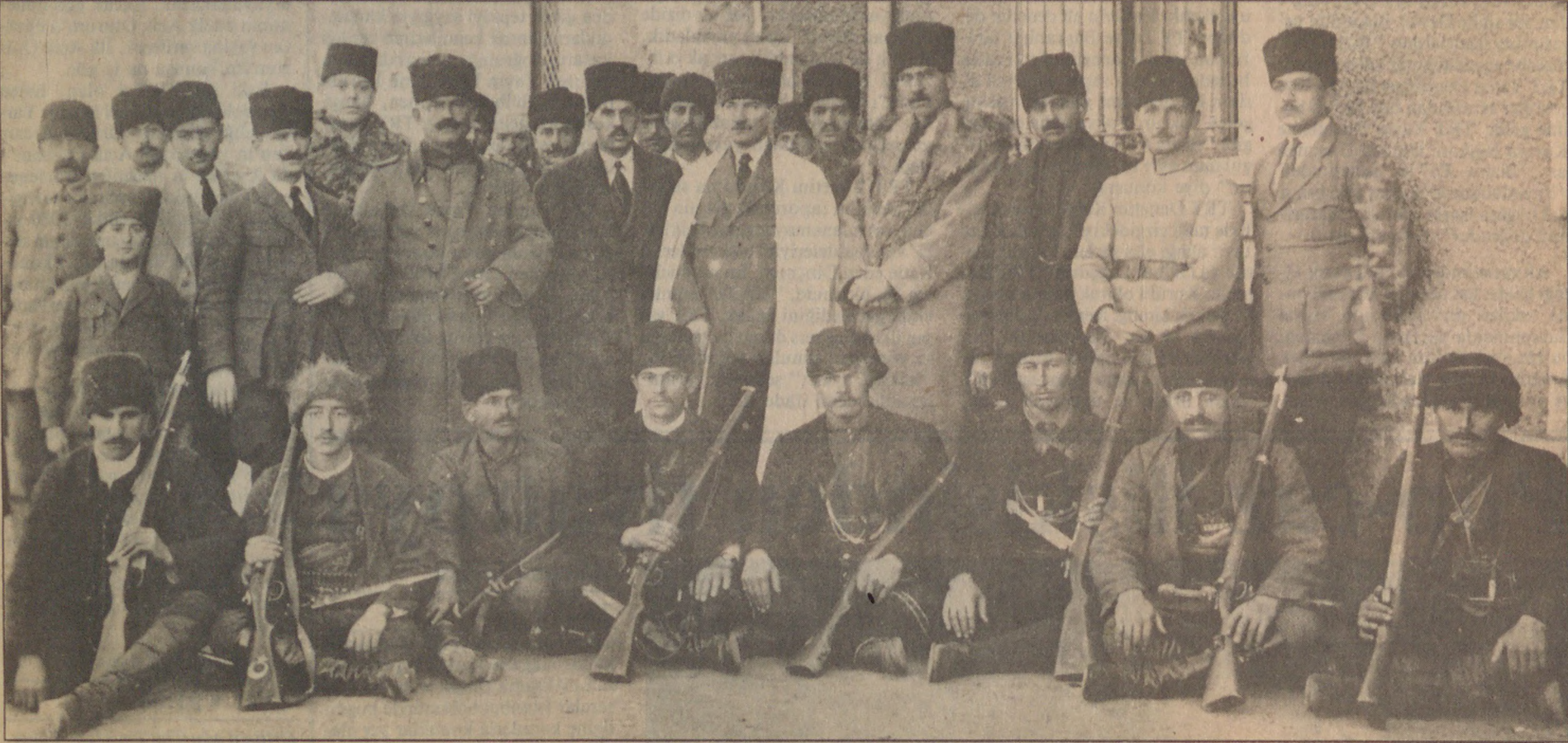
Çerkes Ethem ve adamları Yozgat İsyanı'nı bastırmak amacıyla Ankara'ya geldiklerinde çok sıkı bir şekilde karşılanırlar. Mustafa Kemal ve Kurtuluş Savaşı önderleri, Çerkes Ethem'le yukarıdaki tarihi fotoğrafı çektilerler. (Ayaktakilerden sağdan ikinci İsmet İnönü, dördüncü Çerkes Ethem ve soldan ikinci Kazım Karabekir).

Bolu, Adapazarı, Anzavur ve Yozgat ayaklanmaları Ethem Bey tarafından bastırılır, Ankara nefes alır