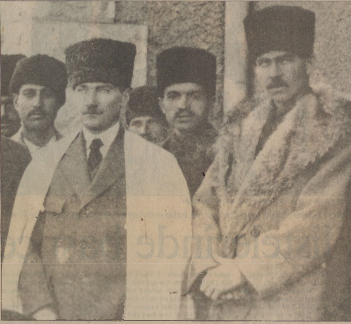
Meclis'in Ethem'den yana ağırlık kazanması Mustafa Kemal'i rahatsız eder. Ve önce alttan alta, daha sonra da açıkça çatışmaya başlarlar.

İşte bugünlerde Fuat Paşa'nın yerine Batı Cephesi'ne atanan İsmet Paşa ve Refet Paşa ile Tevfik Bey'in arası açılır. Tevfik, bu ko-