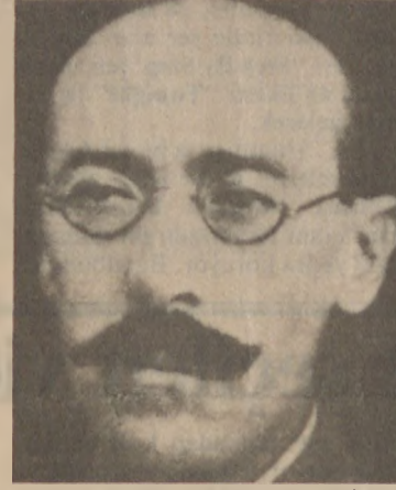
Kendisi de Çerkes olan Yusuf İzzet Paşa, Reşit ve Ethem beyleri uyarak seyfar kuvvetlerin günü geldiğinde görevinin sona ereceğini söyler.

Gediz Savaşı sırasında, Batı Cephesi Kumandanı Ali Fuat Çebesoy'dur. Fuat Paşa'yı vaktiye bir cephe komutanlığına Çerkes Ethem önermiş ve gerçekleştirmişti. Zaten Fuat Paşa'nın komutanlığı sırasında Kuvay-ı Seyyare ile düzenli ordu arasında önemli bir anlaş-