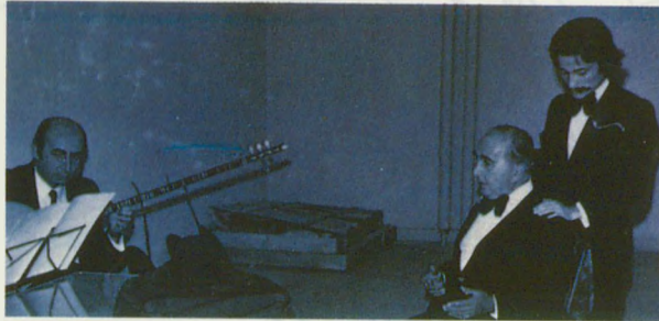
Babasının 60. sanat yılı jübilesinde. / At his father's 60th year jubilee.

At the age of six Timur Selçuk began taking lessons in piano, solfege, and harmonics at Istanbul Municipal Conservatory, and at 18 went to Paris to study piano, composition and conducting at the Ecole