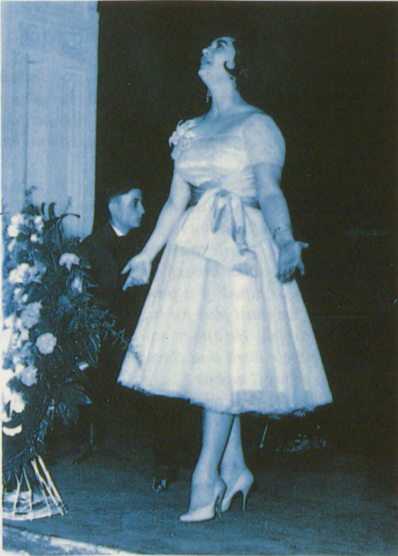
Timur Selçuk annesine piyanoyla eşlik ediyor. Yandaki fotoğrafta ise ilkokul yıllarında yavrukurtken / Timur Selçuk accompanying his mother on piano at a singing recital. Right: Timur the cub scout.

"Ayrılanlar İçin", "Beyaz Güvercin" ve "İspanyol Meyhanesi" 20 yılı aşkın bir süredir belleklerde. Bu şarkılar bestelendikleri dönemlerde Türkiye'deki birçok insanın içine işleyen, kendilerinden birşeyler buldukları şarkılar oldu. Selçuk, "Coşkulu şarkılarımda bile öyle insanı gözyaşlarına boğuveren bir yorum yoktur. Daima ölçülüdür. Bir ayrılık şarkısı söylediğimde dahi, insanların şarkının sonunda iki ayaklarıyla yere sağlam basmalarını gerektiğini düşündüm ve bu düşüncemi yansıttım" diyor. Laubaliliği hiç sevmediğini vurguluyor. Seyirciyle arasına her zaman ölçülü bir mesafe koymaktan yana.