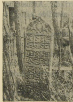
Hacı Bayram Kaftani'nin baş mezar taşı Stèle de Hadji Bayram Kaftani