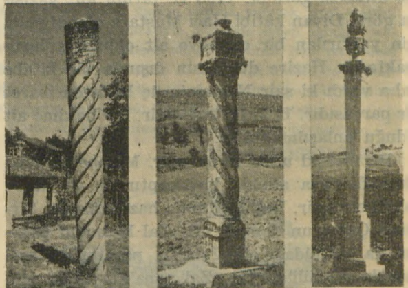
Okmeydanındaki Anıt'lara dair bir kaç örnek Quelques modèles des monuments érigés à Okmeydan

Yusuf paşa, gürcü olup yeniçeri ocağından