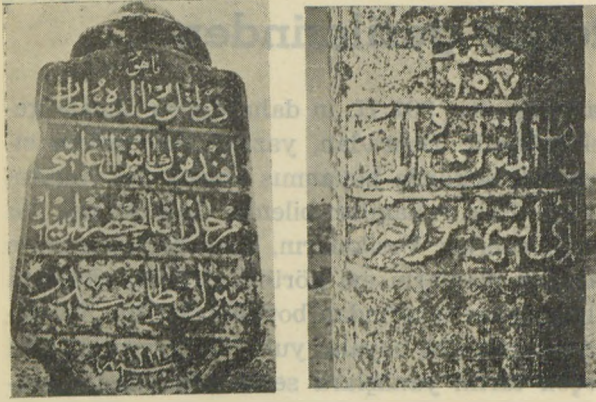
Mercan ağasının ok menzil taşı