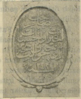
Ahmed Kethüda camideki su küpünün yazısı Inscription ornant la jarre se trouvant à la mosquée d'Ahmed Kethuda