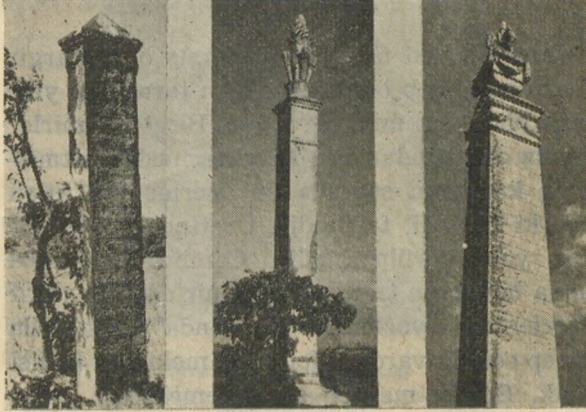
Okmeydanındaki Anıt'lara dair bir kaç örnek Quelques modèles des monuments érigés à Okmeydan

İstanbul'u Sevenlere geçen ay Aksaray civarında yaptığımız bir gezintinin raporunu sunmuştuk. Bu ay da aynı çevredeki incelemeye devam ettik. Hekimoğlu Alipaşa caddesinde Hacibayram Kaftanı camii ile mezarlarını, Yusuf-