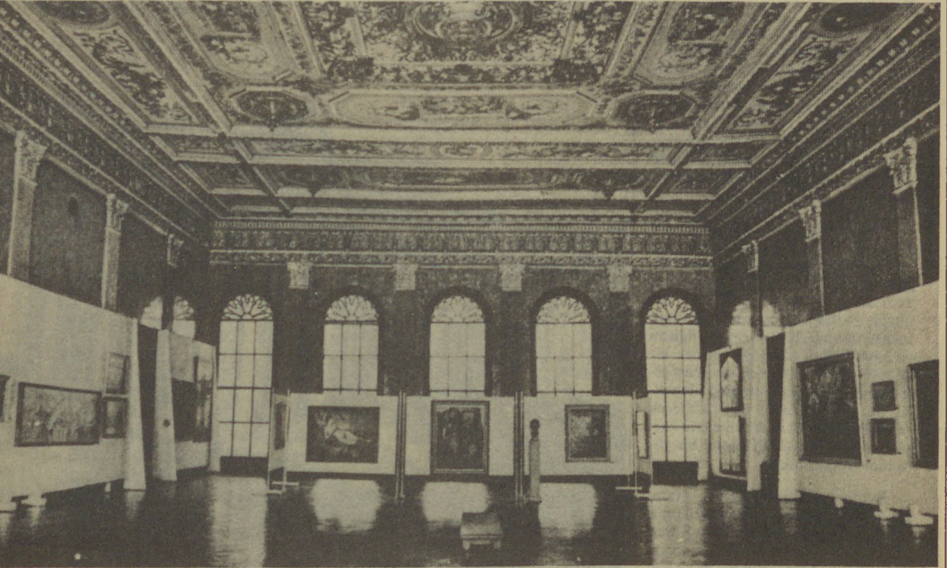
İstanbul Resim ve Heykel Müzesi'nin iç sergilerden bir görüntü

Öte yandan İstanbul Resim ve Heykel Müzesi'nin, liberalleşme koşullarında özel bir hız kazanan galeriler ve koleksiyonlar sorunu karşısında rekabet edebilen aktif bir rol oynar duruma getirilmesi, yön verip irşad eden devletin onur görevidir. Beş parasız müze mi olur? Alım gücü ancak akademi atölyelerindeki üç beş sanatçıya kadar uzanabilen bir kıstınlık içinde bulunan müze mi olur? Müzenin doğru dürüst bir arşivi olmadığı gibi, etkisini sürekli kılabilcek yayınları da yoktur. Müze binasının onarımı Milli Saraylar Dairesi'nce tamamlandıktan sonra durumun ne olacağı şimdiden sorulmaya değer. Yönetimi ve bütçesi Mimar Sinan Üniversitesi'ne bağlı kalacaksa tüm gereksinimleri karşılanabilecek midir? ■